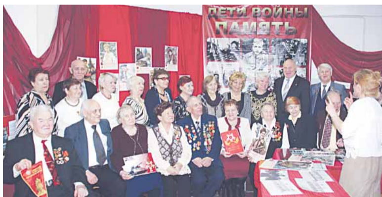
Полосу подготовил Богдан Колесников