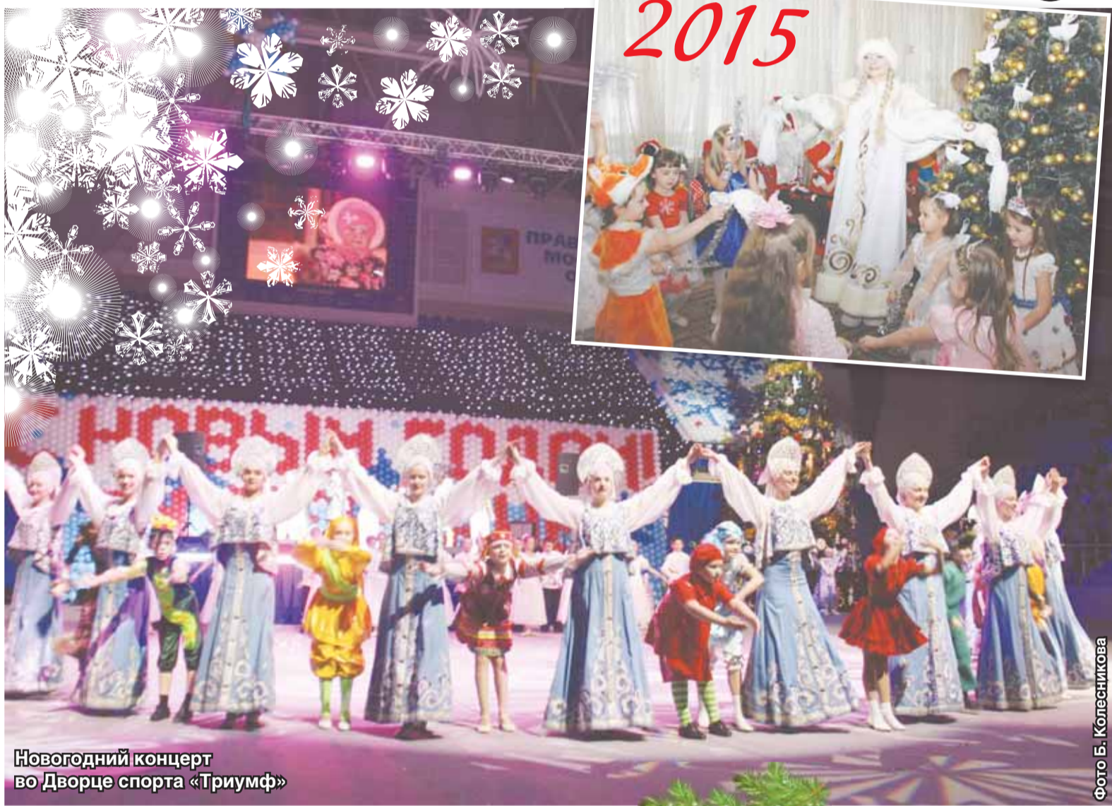
Новогодний концерт во Дворце спорта «Триумф»