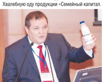
Хвалебную оду продукции «Семейный капитал»

– Мы выбрали свой путь – поднять сельское хозяйство России на небывалую высоту, накормить наш народ качественными, натуральными продуктами питания по доступной цене. Садоводы, пенсионеры – это опора нашего кооператива. Это люди, у которых есть излишки сельскохозяйственной продукции. И мы можем построить свои перерабатывающие центры, куда они смогут привезти свои овощи и фрукты. Каждый пайщик кооператива является частью одного большого и благородного дела. Цены в других магазинах постоянно растут, а зарплаты у людей остаются такие же. Мы же занимаемся продовольственной безопасностью. Даем возможность людям чувствовать себя стабильно. Ведь цены в наших магазинах не меняются годами! Каждый пайщик знает, что его деньги идут на благое дело и имеет возможность приобретать продовольственные товары, производимые на заводе – членах КПК «Семейный капитал», со значительными скидками.