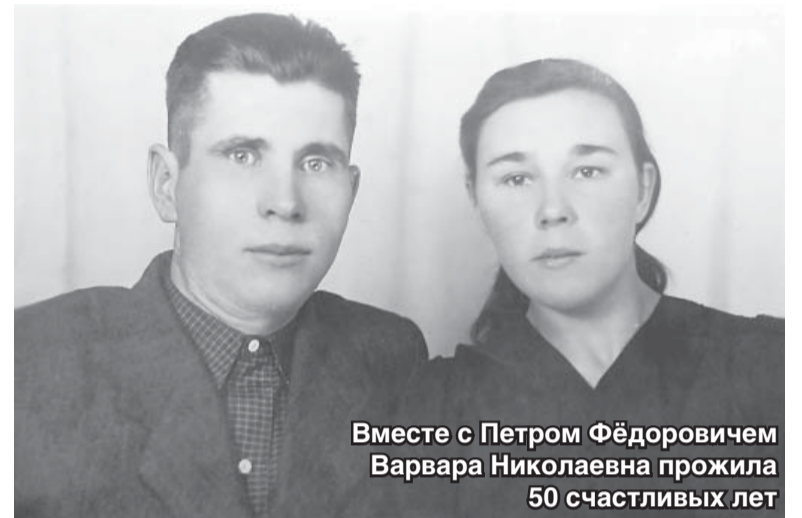
Вместе с Петром Фёдоровичем Варвара Николаевна прожила 50 счастливых лет

Богдан КОЛЕСНИКОВ