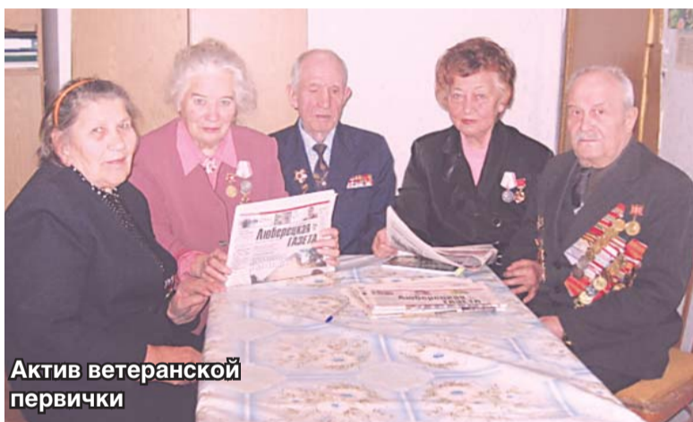
Актив ветеранской первички