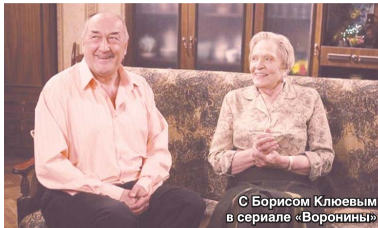
С Борисом Клевым в сериале «Воронины»