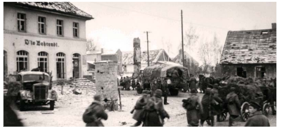
Немцы бегут из Кёнигсберга

6 февраля 1945 г. — Ставка Верховного Главнокомандования направила директиву о реорганизации 1-го Прибалтийского и 3-го Белорусского фронтов и привлечении 1-го Прибалтийского фронта к проведению Восточно-Прусской операции. По решению Ставки 6 февраля 2-й Прибалтийский фронт вошёл в себя войска 1-го Прибалтийского, управление которого в свою очередь приняло 43-ю, 39-ю и 11-ю гвардейскую армии из 3-го Белорусского фронта.