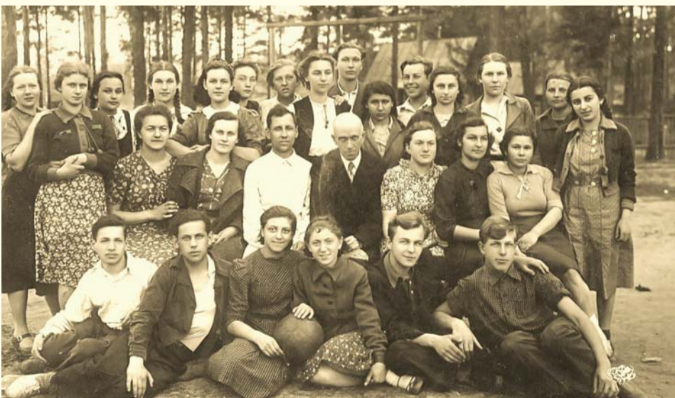
9 класс «А», май 1940 г.

сы были как из окончивших начальную школу «на Котике», так и из тех, что учились здесь с первого класса. Впервые на этой групповой фотографии 5 «А» появляется