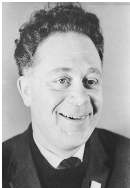
Таким он пришёл к нам в 9-й класс

«Я себя под Лениным чищу, — говорил любимый им Маяковский, — чтобы плыть в революцию дальше». А у нас есть свой — вечно живой, с которым мы, ученики его (давно уже дедушки-бабушки, а кто и пра-, а всё — ученики), сверяем свои шаги в жизни, к кому обращаемся мысленно за советом всякий раз... И куда плывём?