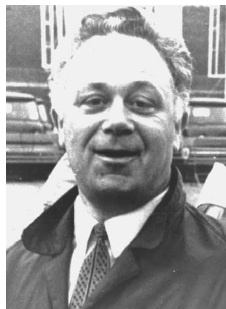
А таким мы ещё застали его на подходе к 55. Каких-то 15 лет, а ведь это — жизнь целого поколения неуспокоенных.

Подвергай всё сомнению, — повторял нам учитель вслед за древними мудрецами. И сам сомневался. И нас приучил. Вот и подвергаем всё сомнению — вслед за учителем. Мы хотели быть похожими, мы старались подражать. Да не всем по силам его жизненный принцип: «До объяснений не унижусь». Где уж там! И всё же — слава Богу — верим в доброту людскую и душевный дар, всё ж остаёмся