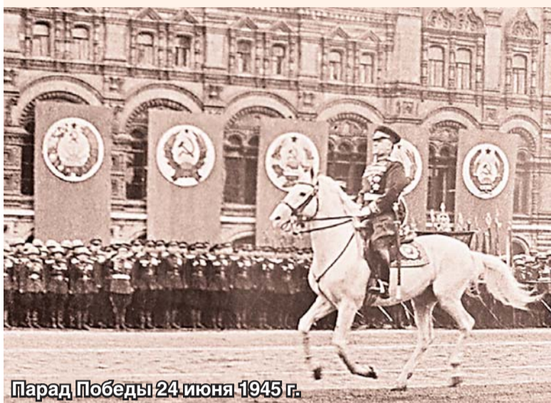
Парад Победы 24 июня 1945 г.

Весьма знаменательно, что именно в День памяти великомученика Георгия Победоносца, в Светлое Христово Воскресенье, 6 мая 1945 года, капитулировала фашистская Германия.