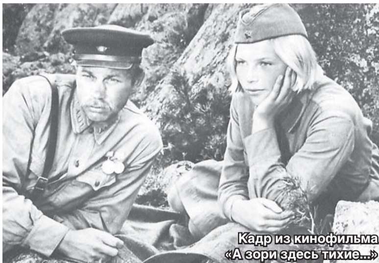
Кадр из кинофильма «А зори здесь тихие...»