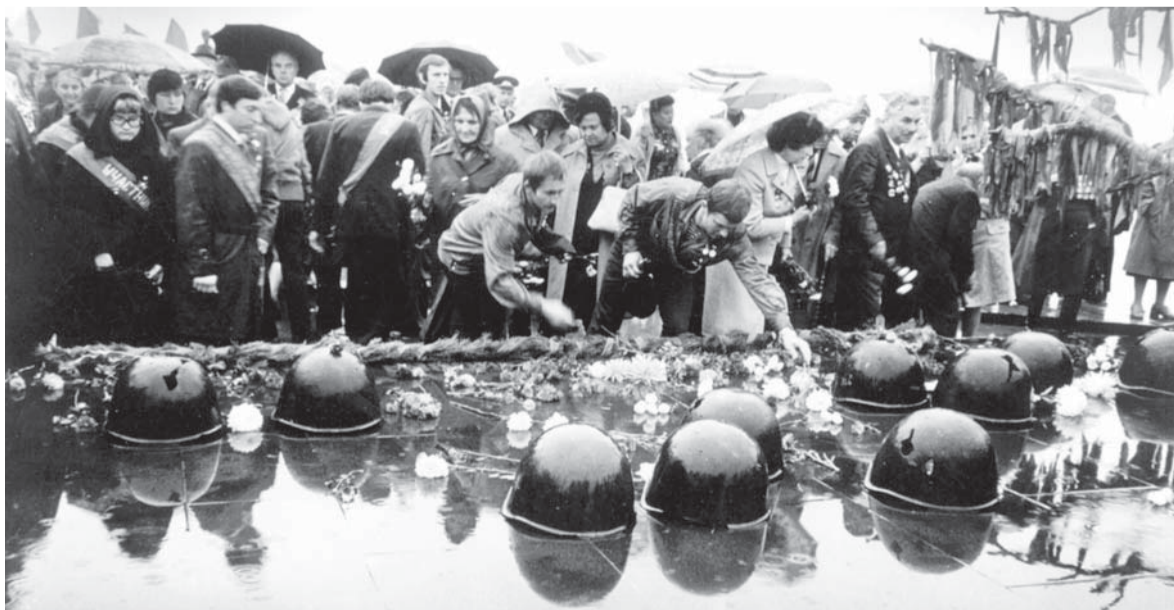
Люберецкие ветераны возлагают цветы к мемориалу «Солдатское поле» в Волгограде

Мы предлагаем вам окунуться в историю и познакомиться с редкими фотографиями Олега Грицева, сделанными во время встреч наших ветеранов Великой Отечественной войны в разные годы.