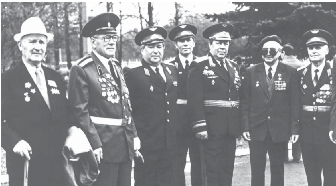
Ветераны у Вечного огня на Октябрьском проспекте, 9 мая 1992 г.