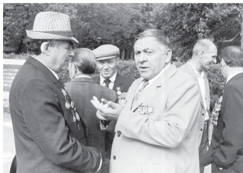
Встреча ветеранов 108-го Гвардейского штурмового авиационного полка. Люберцы, сентябрь 1985 г.