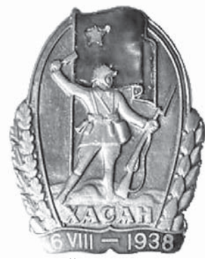
Нагрудный знак участника боев на озере Хасан