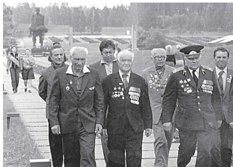
Люберецкие фронтовики в Хатыни, 27 июня 1984 г.