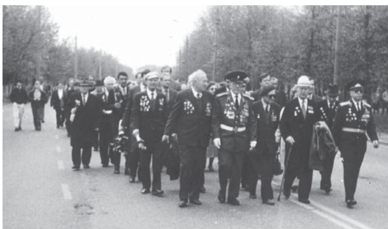
Шествие участников Великой Отечественной войны по Октябрьскому проспекту в Люберцах, 9 мая 1992 г.

Спасибо всем, кто жизнь отдал, За Русь родную, за свободу, Кто страх забыл и воевал, Служа любимому народу.