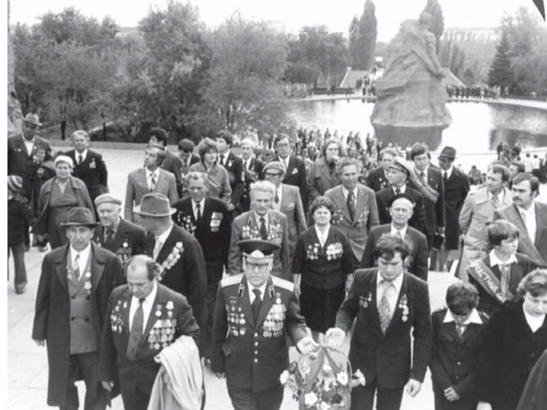
Наши фронтовики были постоянными участниками автопробега дорогами славы. Посещение мемориального комплекса «Мамаев курган». Осень 1982 г.