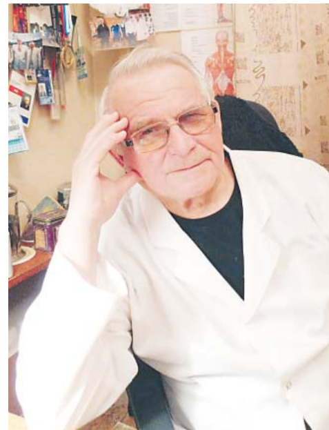
праздники редки в нашей жизни, и День Победы – самый лучший из них.

– Вместе со взрослыми мы ощущали беспредельное счастье и ликование. Такие