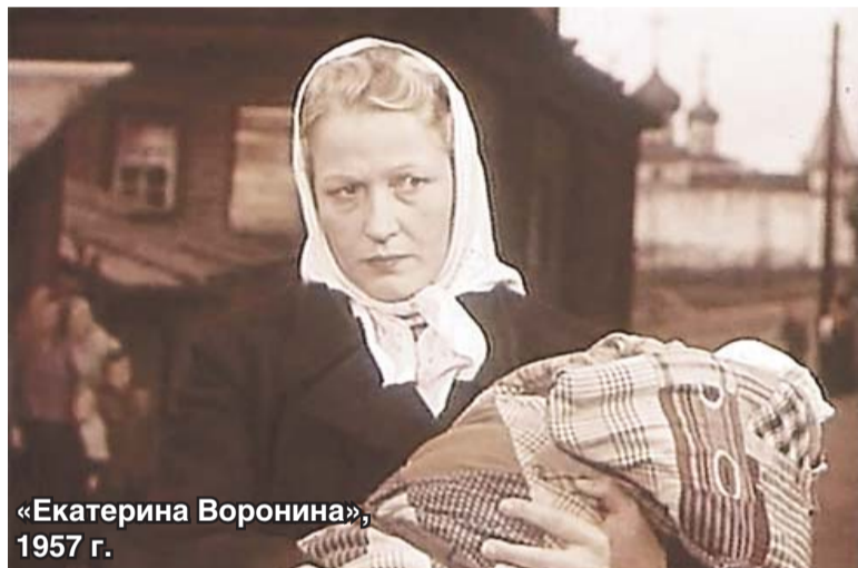
«Екатерина Воронина», 1957 г.

– Когда молодой и никому ещё неизвестный режиссёр пригласил