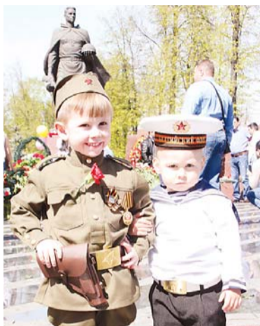
Самое младшее поколение победителей на боевом посту