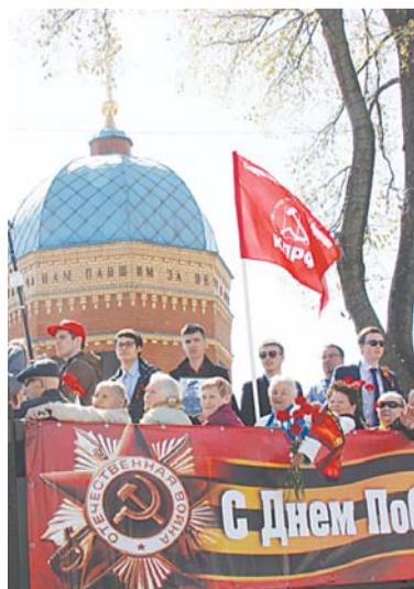
«Дети войны» в компании люберецкого Молодёжного парламента