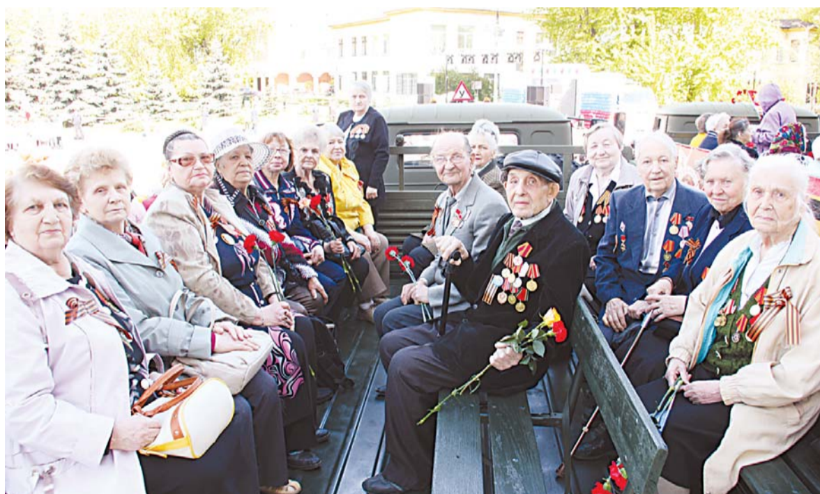
Фронтовики, труженики тыла и бывшие малолетние узники фашистских концентрационных лагерей проехали по Октябрьскому проспекту на военных грузовиках