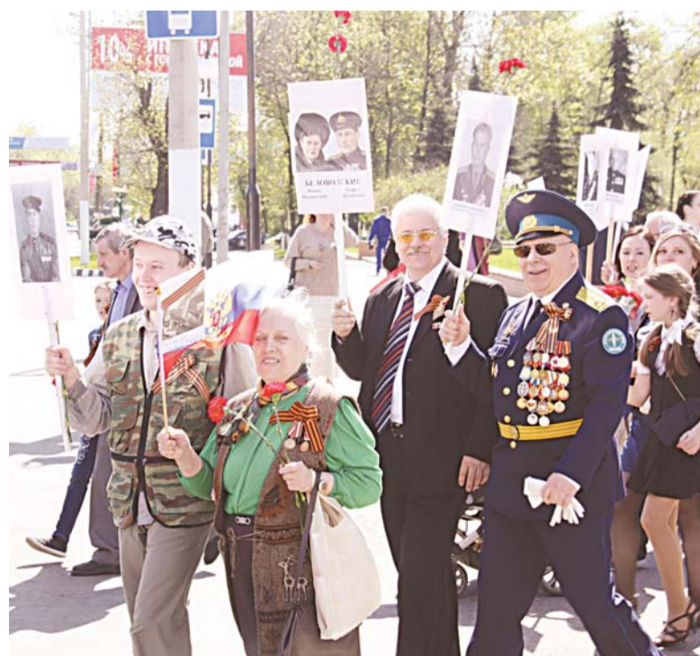
Люди с гордостью несли портреты своих родственников, благодаря которым уже в 70-й раз мы празднуем годовщину Победы над фашистской Германией