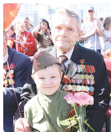
Некоторые фронтовики приходили на праздник со своими правнуками