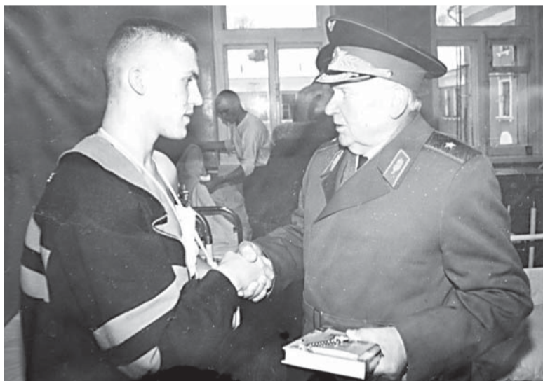
Генерал Васенин навещает участников чеченской войны. Главный военный клинический госпиталь имени академика Н.Н. Бурденко. Москва

И 91 год мне только по паспорту, на самом деле я родился в 1926-м.