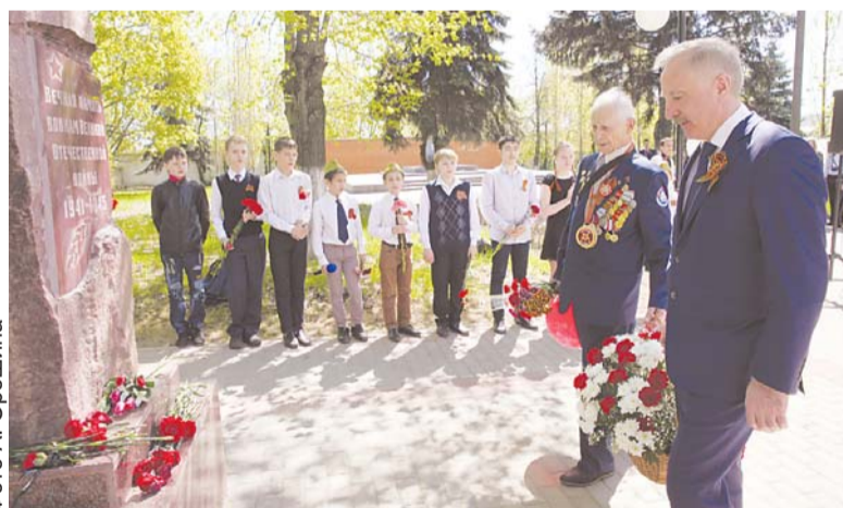
Глава Люберецкого района и города Люберцы В. Ружицкий возложил цветы к мемориальному комплексу на Инициативной улице