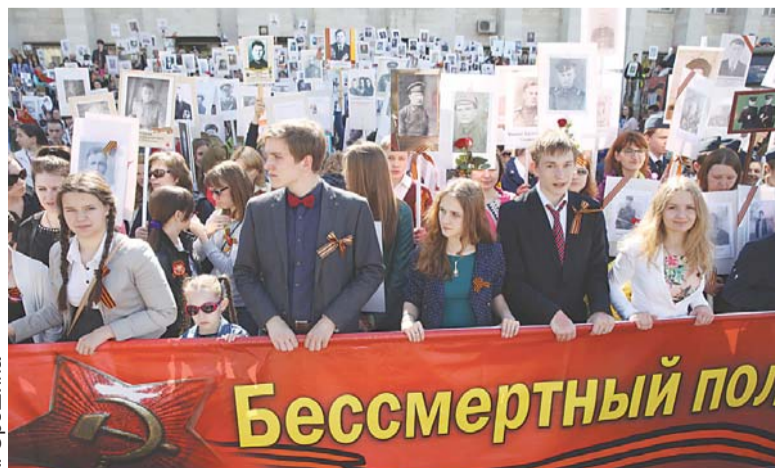
Больше тысячи наших земляков приняли участие в памятной акции «Бессмертный полк»