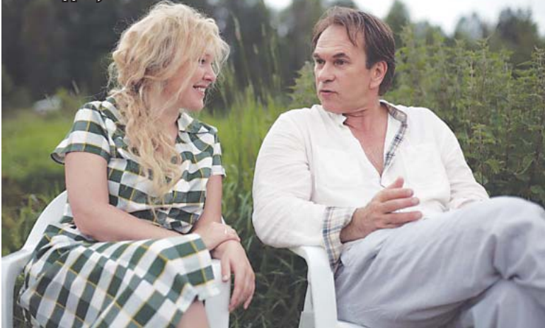
Кадр из кинофильма «Жажда», 2013 г.