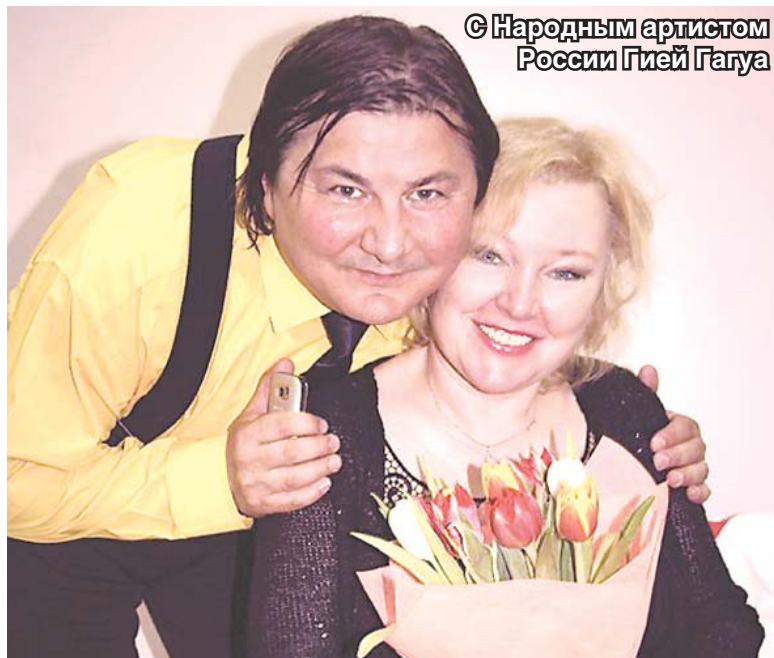
© Народным артистом России Гией Гагуа

Богдан КОЛЕСНИКОВ Фото автора и из архива