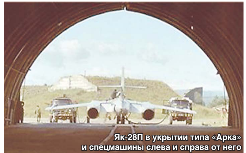
Як-28П в укрытии типа «Арка» и спецмашины слева и справа от него

блюдовать «наставление по инженерной авиационной службе» и действующее в авиации правило «Доверяй, но проверяй».