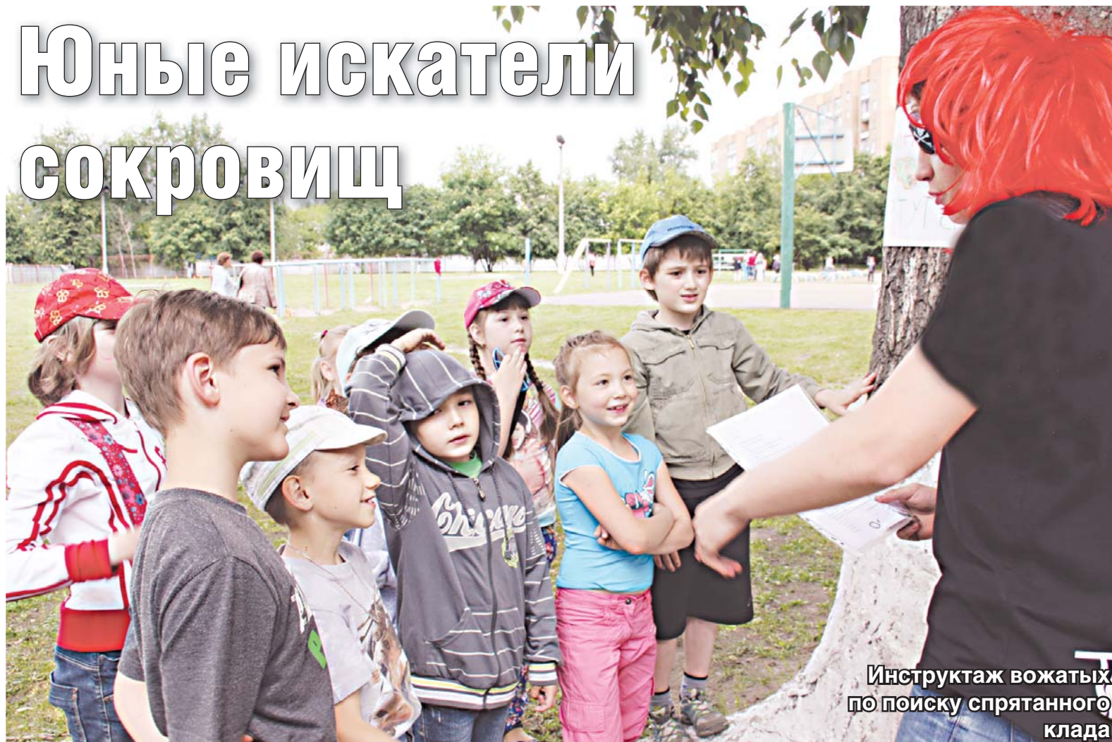
Инструктаж вожатых по поиску спрятанного клада

Уже с восьми утра в 34 школах Люберецкого района раздаются звонкие детские голоса. Пока выпускники сдают государственные экзамены, младшие школьники время зря тоже не теряют – отдыхают и набираются новых сил в городских оздоровительных лагерях.