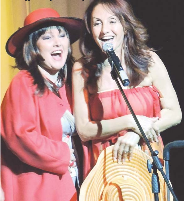
Сцена из спектакля «Разведёнки-брошенки», 2014 г.

Роман с красным дипломом окончил физкультурное училище и серьёзно увлекается спортом. Поэтому в кино он машет кулачками то в роли полицейского, то бандюгана. (Смеётся).