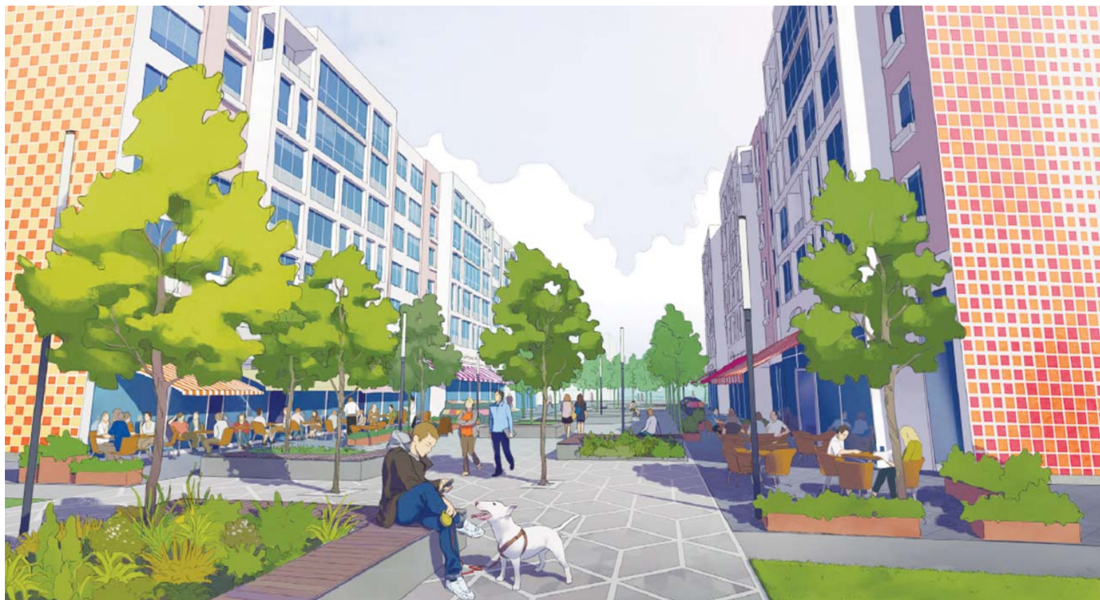
Для строящегося микрорайона около деревни Жилино-1 разработан план обустройства, отвечающий всем современным требованиям

Первоначальный проект застройки, которая ведется на территории 56 гектаров в районе деревни Жилино-1, уже претерпел ряд изменений: была снижена этажность возводимых домов. Теперь, чтобы придать району «человеческий облик», застройщик – компания «ТомСтрой» – обратился в агентство «Городские проекты», имеющее опыт разработки качественной городской инфраструктуры.