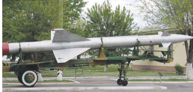
Ракета ЗРК С-25 «Беркут» в музее полигона «Капустин Яр», г. Знаменск

чать обстрел, ей было необходимо знать цели и указания. Группа солдат вытащила меня на берег. Командир батареи уже там. Цель ясна, батареи дают огонь. Сначала меня наградили медалью «За отвагу», а за форсирование Западной Двины – орденом Красной Звезды.