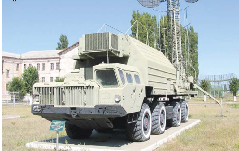
Музей полигона «Капустин Яр». Агрегат 15В75

Полки и дивизии формировались из вновь прибывшей молодёжи. Дальше нашей 6-й гвардейской армии была поставлена задача: повернув на север от Витебска в сторону Прибалтики, прорваться в Литву и выйти к Балтийскому морю, чтобы отсеять 300-тысячную курляндскую группировку вермахта. Поставленная задача была выполнена. В составе других подразделений Прибалтийского фронта мы освободили и взяли прибалтийские города Добеле, Шауляй, Даугавпилс, штурмовали