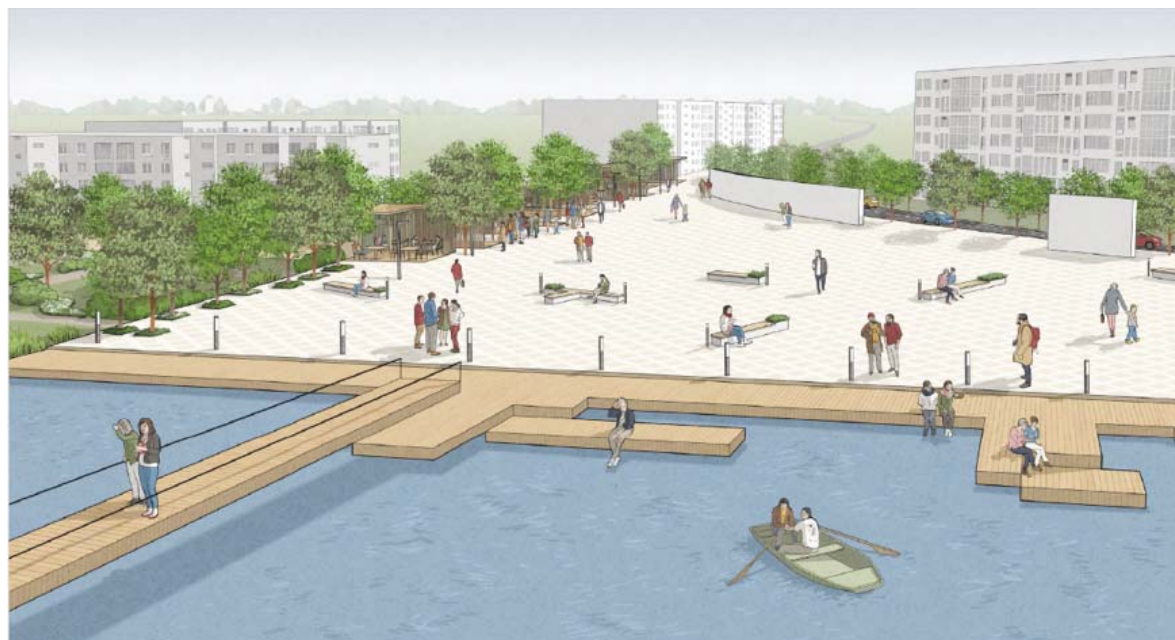
Набережная, оформленная террасной доской, так и приглашает присесть. Такое решение не только привлекательнее и «человечнее», но и дешевле в реализации

скорости идущего человека: для прогулки подойдет брусчатка, а для быстрой ходьбы нужны