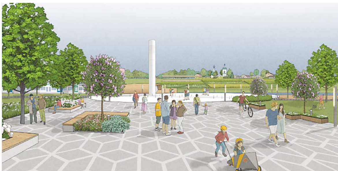
Соблюдено важное условие, которое было поставлено застройщиком перед авторами проекта: сохранить для жителей вид на храм Успения Пресвятой Богородицы в Томилино

По плану центром микрорайона должен стать пруд и окружающая его прогулочная зона. Здесь предлагается проводить общественные досугово-культурные мероприятия. На берегах пруда появится деревянная набережная, беседки, кафе, скамейки и клумбы.