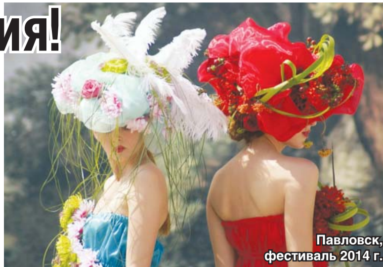
Павловск, фестиваль 2014 г.

Конечно, «провинциальным» юбилейный, XV Международный фестиваль ландшафтного и цветочного искусства в Павловске «Императорский букет», близ северной столицы, назвать нельзя. Но мы все-таки решили рассказать вам об этом весьма значимом событии. От Люберец до Павловска на автомобиле (без пробок и гонки) около 9 часов езды; или поездом до Санкт-Петербурга, а там на электричке или автобусе – рукой подать. И перед вами – такая красота, такой отдых для души! Впрочем, всё по порядку.