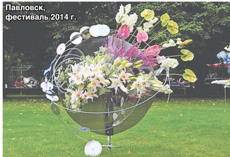
Павловск, фестиваль 2014 г.

из многих садовых товариществ, где клубника (земляника садовая) тоже в большом почете. Яркое костюмированное «клубничное» шествие состоялось здесь по набережной Волги; участники праздника смогли получить немало советов от знатоков по возделыванию клубники, познакомиться с лучшими ее сортами, обменяться рецептами блюд из этой ягоды. А еще – принять участие в конкурсах, состязаниях, играх и дегустациях, приобрести саженцы этой культуры от производителей и спелую, свежайшую клубнику.