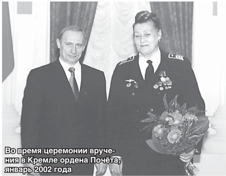
Во время церемонии вручения в Кремле ордена Почёта, январь 2002 года