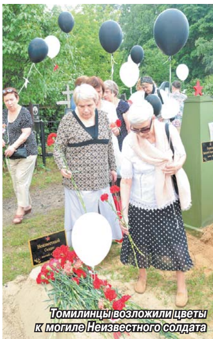
Томилинцы возложили цветы к могиле Неизвестного солдата

Выступление в честь ветеранов войны и тружеников тыла подготовили учащиеся школы № 14. Подростки зажгли 74 траурные свечи. По инициативе группы активистов «Наследники Победы» к ветвям плакучей ивы были привязаны несколько десятков колокольчиков, которые нежным звоном напоминают нам о великих потерях в ходе Великой Отечественной. А в небо под звуки песни «Журавли» поднялись 74 воздушных шара, унесших серебристых и алых журавликов – символ скорби и вечной памяти. Пожилые жители Томилино прочитали стихотворения,