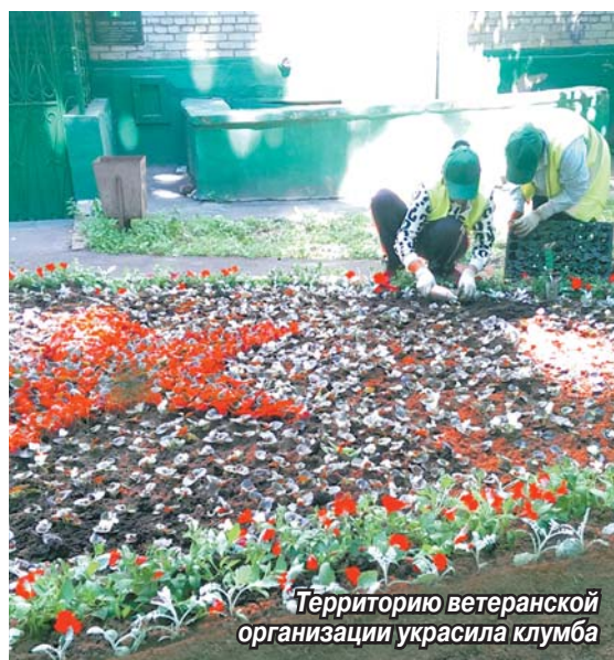
Территорию ветеранской организации украсила клумба

У томилинского Совета ветеранов появилась своя цветочная клумба. Ее для общественной организации, объединяющей пожилых жителей поселка, «разбили» специалисты Управления благоустройства и активные жительницы Томилино.