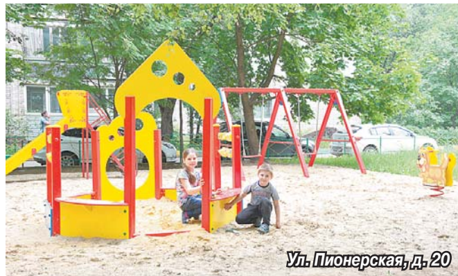
Ул. Пионерская, д. 20

Отвечающие санитарным нормам и требованиям безопасности игровые зоны появились на ул. Пионерская у домов №№ 20 и 24. В районе дома № 20 все игровые снаряды админи-