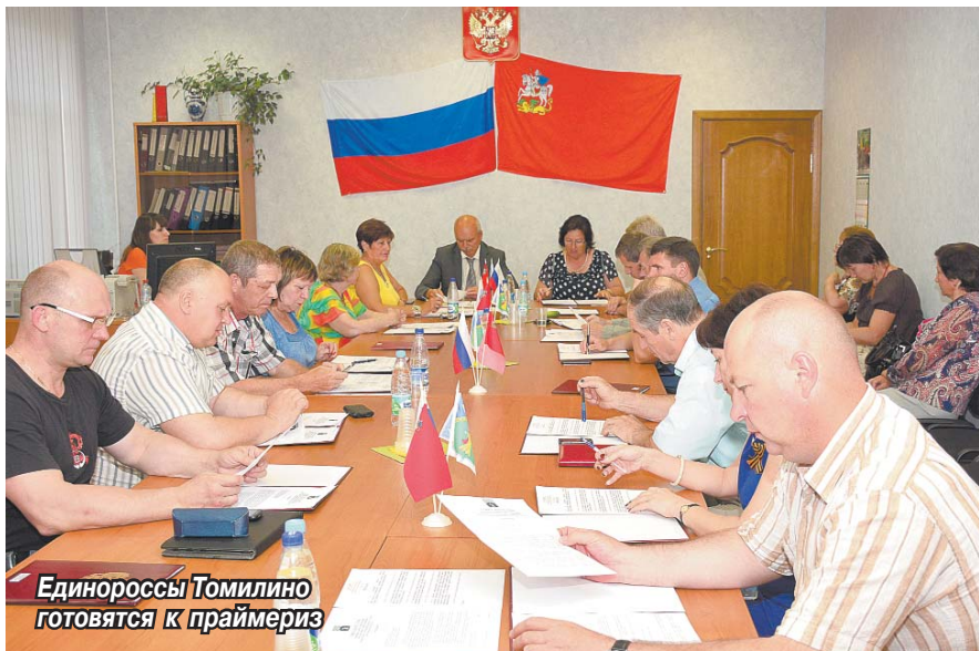
Единые россы Томилино готовятся к праймериз