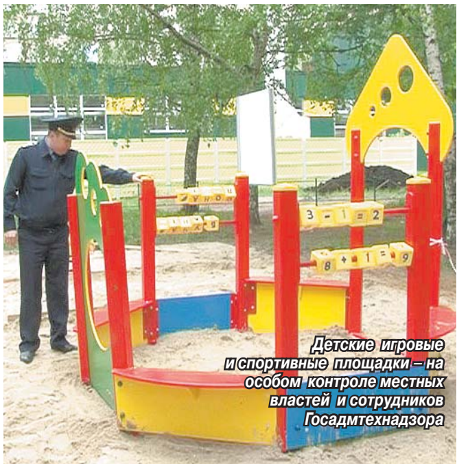
Детские игровые и спортивные площадки – на особом контроле местных властей и сотрудников Госадмтехнадзора

Санитарное состояние томилинских детских игровых и спортивных площадок под постоянным контролем сотрудников Госадмтехнадзора.