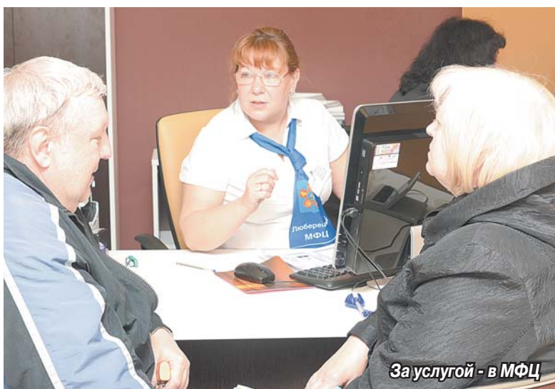
За услугой - в МФЦ

Что такое Многофункциональный центр и какие услуги он предоставляет сегодня? На эти вопросы жителям Томилино ответили специалисты МФЦ.