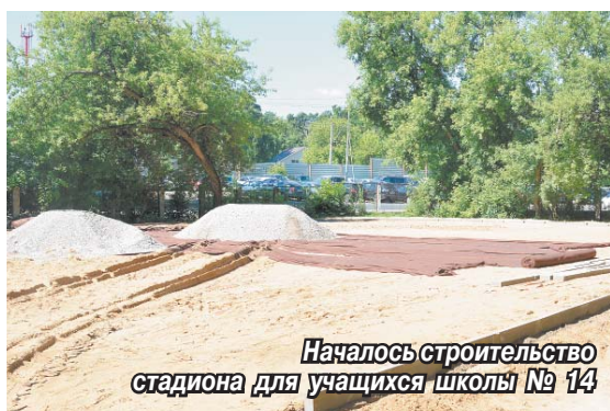
Началось строительство стадиона для учащихся школы № 14

Школа №14 к 1 сентября в подарок от администрации г.п. Томилино получит стадион.