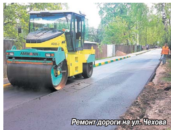
Ремонт дороги на ул. Чехова

В Томилино кипит работа по реконструкции и ремонту дорог.