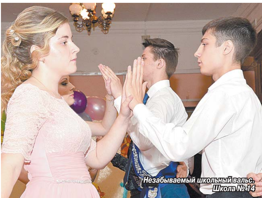
Незабываемый школьный вальс. Школа № 14