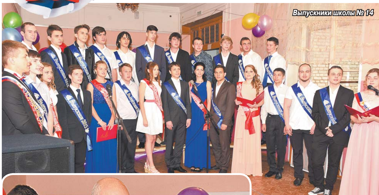
Выпускники школы № 14