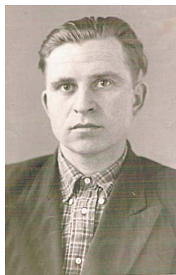
До последних дней он оставался активным, занимался правнуками, работал в огороде.