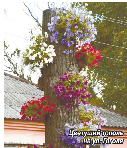
Цветущий тополь на ул. Гоголя