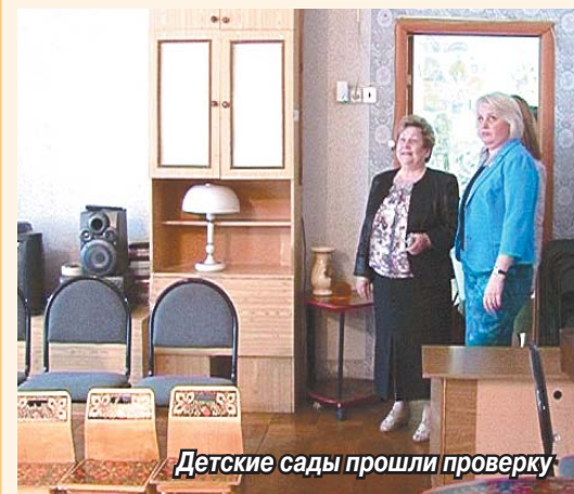
Детские сады прошли проверку

Все тринадцать образовательных учреждений поселка готовы к новому учебному году.