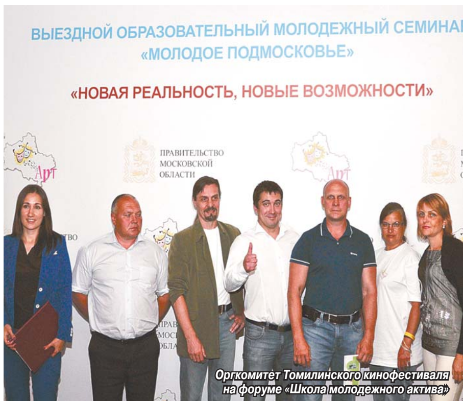
Оргкомитет Томилинского кинофестиваля на форуме «Школа молодёжного актива»

Томилинский молодежный кинофестиваль «ПРОдвижение» начинает свое шествие по Подмосковию. Цель этого проекта – помочь талантливым молодым людям раскрыть творческие способности в области кинематографии.