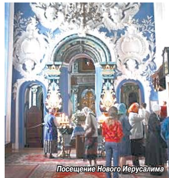
Посещение Нового Иерусалима

Прикоснуться к палестинским святыням, увидеть места спасительных страстей и Воскресения Христова... Все это для пожилых жителей мкр. «Птицефабрика» стало возможным благодаря экскурсии в Новый Иерусалим, которую организовал руководитель Всероссийской общественной организации «Молодая гвардия» в Томилино совместно с депутатами нашего микрорайона.