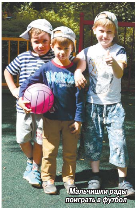
Мальчишки рады поиграть в футбол

И вот уже томиллинские малыши начинают заниматься спортом на специально оборудованных площадках; причем играть на них они смогут круглый год. Такую возможность дает новое покрытие: поверх бетонного основания залита смесь из резиновой крошки и клея специальной марки. Это бесшовное полотно безопасно, антитравматично и способно впитывать влагу, что