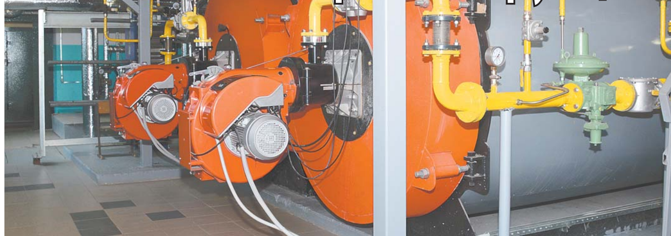
Котельная № 7

Жилищно-коммунальная сфера – сложная, затратная и вызывающая много вопросов отрасль хозяйствования современного муниципального образования. В этом году на ремонт, модернизацию и техническое усовершенствование объектов коммунального хозяйства из бюджета поселка было выделено 86 млн рублей. О том, как они осваиваются, рассказал заместитель главы по ЖКХ Д.Д. Шумский.