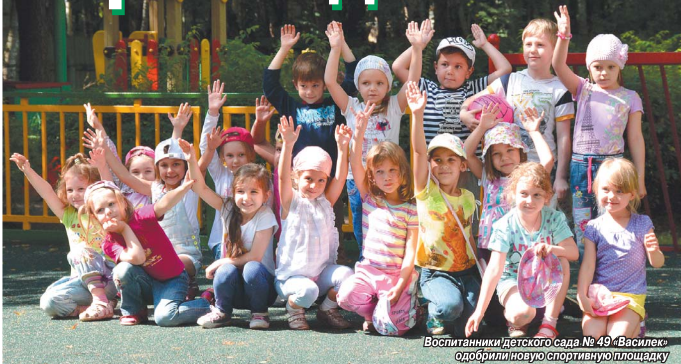
Воспитанники детского сада № 49 «Василек» одобрили новую спортивную площадку

В Томилино продолжается благоустройство дворов многоквартирных домов и территорий общеобразовательных учреждений. Готов к сдаче современный стадион в школе № 14, своя спортивная площадка появилась у юных жителей мкр. «Экопарк», спортивно-игровая зона отдыха создана на ул. Пионерская. Но самое главное – мини-площадки нового поколения с футбольными воротами построены во всех детских садах поселка! Такого внимания к строительству детских игровых и спортивных объектов пока нет ни в одном городском поселении района. На обустройство площадок в детских садах из поселкового бюджета было выделено 5,5 млн рублей.