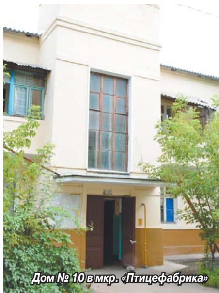
Дом № 10 в мкр. «Птицефабрика»

Управляющая компания МУП «Томилинский жилищный трест» ведет ремонт подъездов многоквартирных домов. Контроль за ходом и качеством работ осуществляют специалисты администрации и председатели Советов многоквартирных домов.