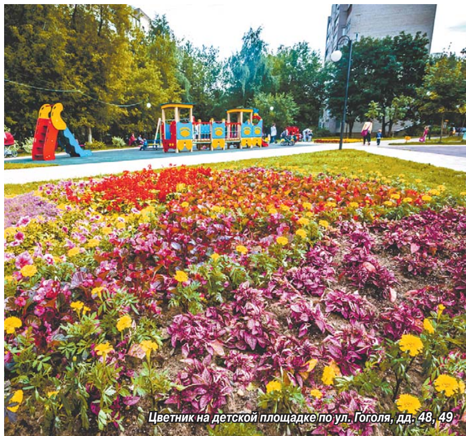
Цветник на детской площадке по ул. Гоголя, дд. 48, 49

Томилино – самый зеленый и цветущий поселок в районе. Таков итог большой и целенаправленной работы, которую томилинцы ведут с учетом правил озеленения и цветочного оформления современных населенных пунктов. В этом сезоне на содержание цветников и газонов из бюджета поселка было выделено более 5 млн рублей.