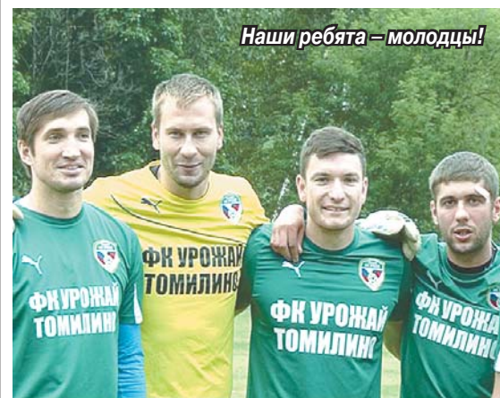
Наши ребята – молодцы!

Томиллинская команда «Урожай-1» с разгромным счетом одержала победу над футболистами из поселка Октябрьский в первом матче второго круга первенства Люберецкого района по футболу.