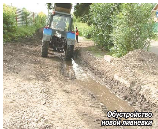
Обустройство новой ливневки

Теперь местные власти приняли решение восстановить ливневую канализацию. Причем средства на эти работы выделяются не «РЖД», как это должно быть, а из местного бюджета. Работы по организации стока поверхностных вод завершатся к концу августа.