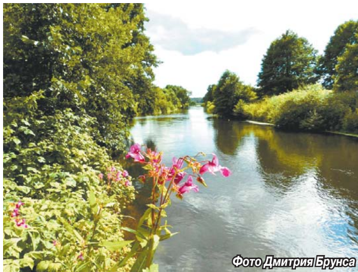
Фото Дмитрия Брунса