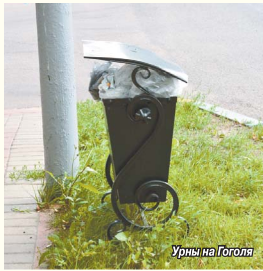
Урны на Гоголя