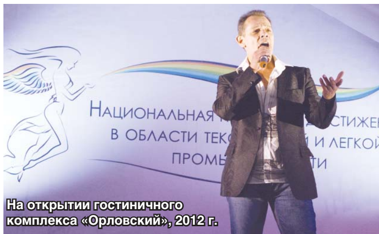
На открытии гостиничного комплекса «Орловский», 2012 г.