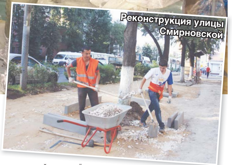
Реконструкция улицы Смирновской

Наши земляки давно обратили внимание, что Люберцы с каждым годом становятся всё красивее и чище. Работы по благоустройству проводятся не только на центральных улицах города, но и во дворах многоквартирных домов. К Дню района преобразится и часть Смирновской улицы – от Октябрьского проспекта до улицы Волковской, где полностью обустроится пешеходная зона. Асфальт будет заменён на тротуарную плитку, а кроме уютных скамеек, цветочных клумб и паркового освещения со встроенными динамиками здесь появится скульптурная композиция.