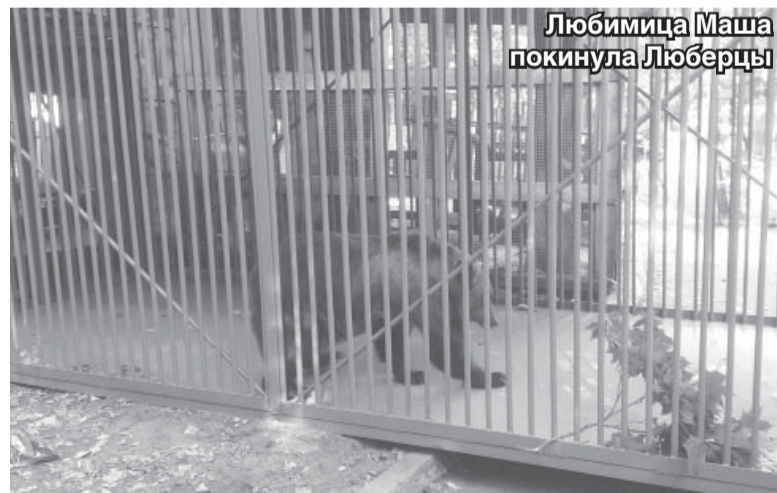
Любимица Маша покинула Люберцы

Пресс-служба администрации Люберецкого района Фото Богдана Колесникова