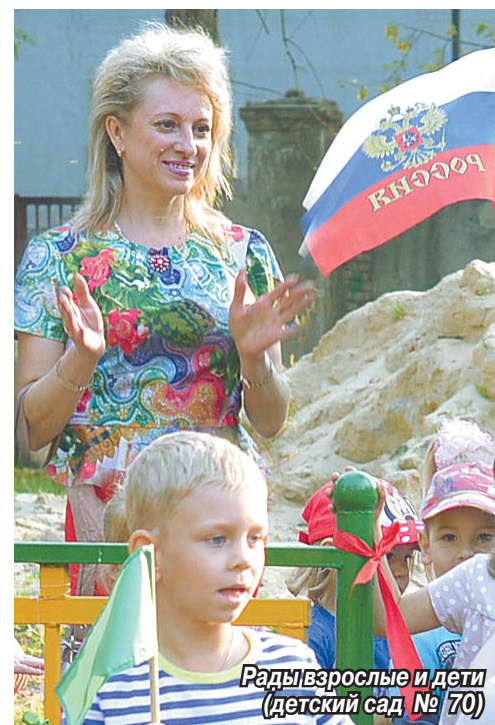
Радость взрослые и дети (детский сад № 70)