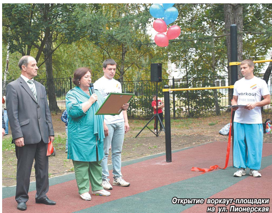
Открытие воркаут-площадки на ул. Пионерская

В северной части Томилино, на ул. Пионерская, д. № 14, состоялась открытие новой воркаут-площадки.