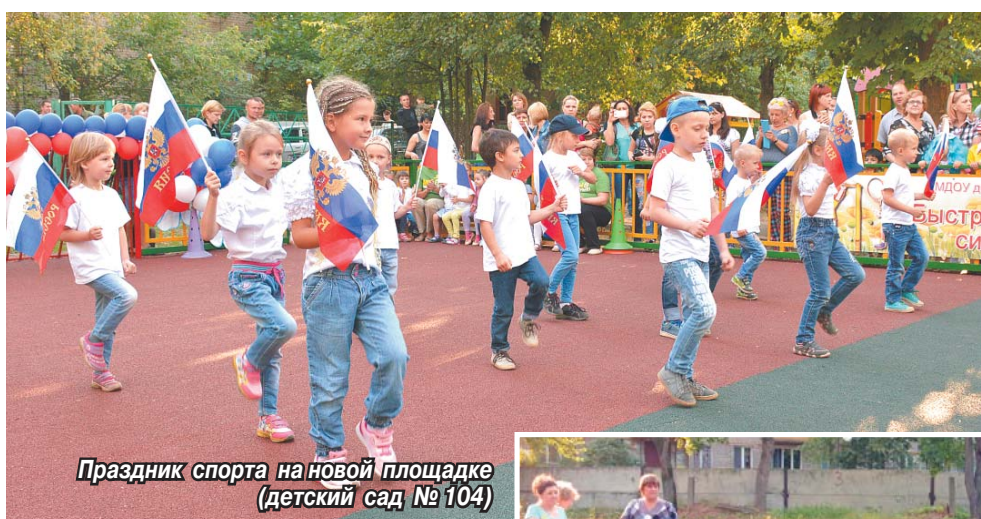
Праздник спорта на новой площадке (детский сад № 104)

Последняя неделя августа запомнилась маленьким жителям Томилино ежедневными спортивно-развлекательными праздниками. А поводом для них стала передача в дар детским садам спортивных площадок, которые в этом году построила администрация для каждого дошкольного учреждения.