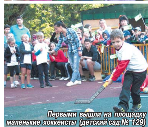
Первыми вышли на площадку маленькие хоккеисты (детский сад № 129)