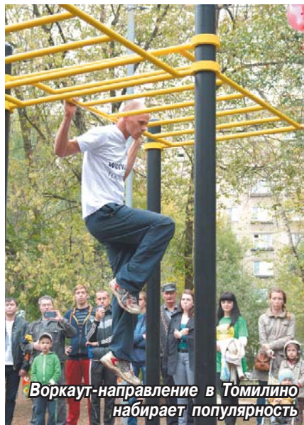
Воркаут-направление в Томилино набирает популярность