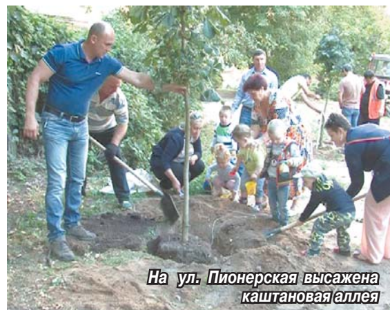
На ул. Пионерская высажена каштановая аллея

Саженцы каштанов украсили улицу Пионерская.