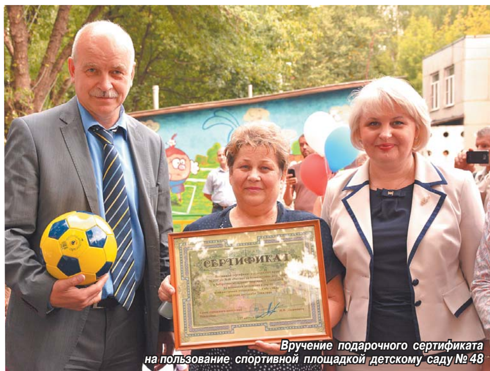
Вручение подарочного сертификата на пользование спортивной площадкой детскому саду № 48

Динара ШАТИЛОВА