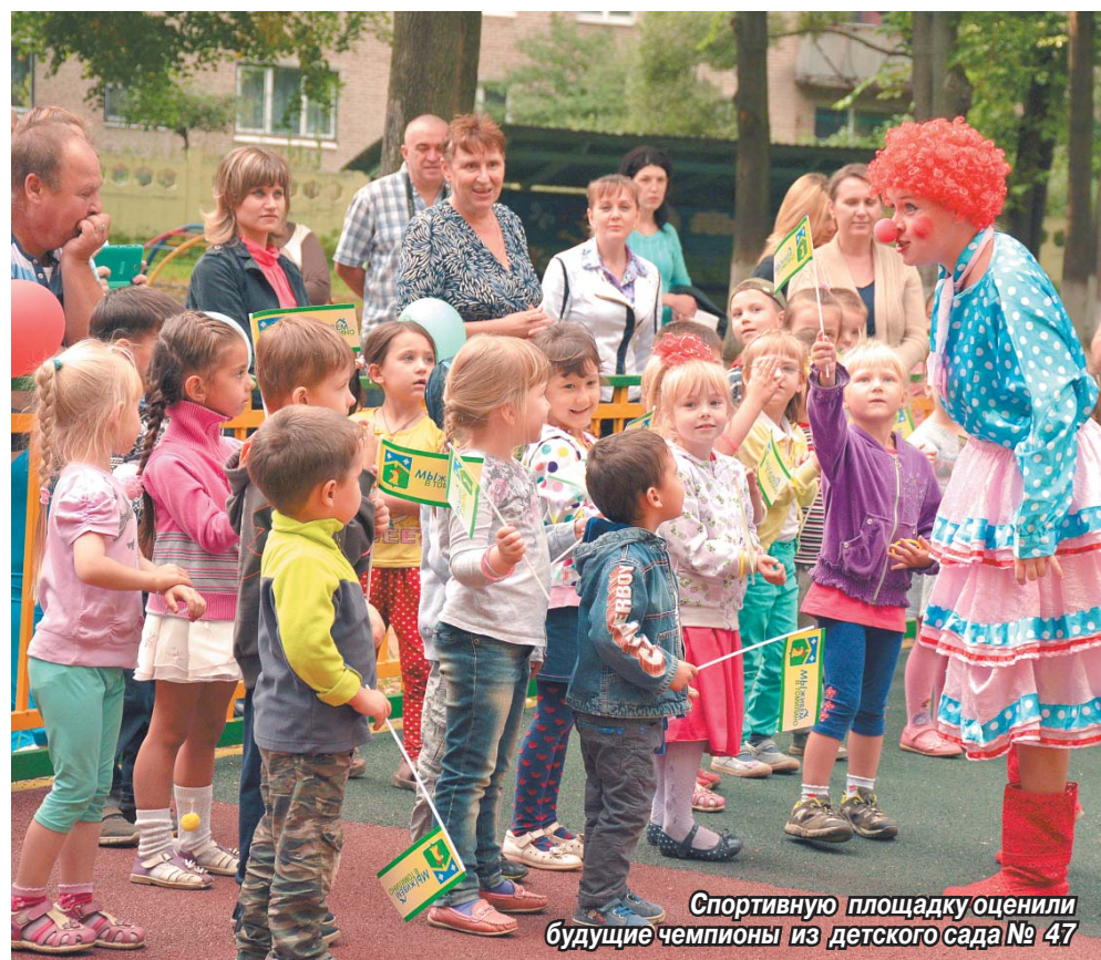
Спортивную площадку оценили будущие чемпионы из детского сада № 47