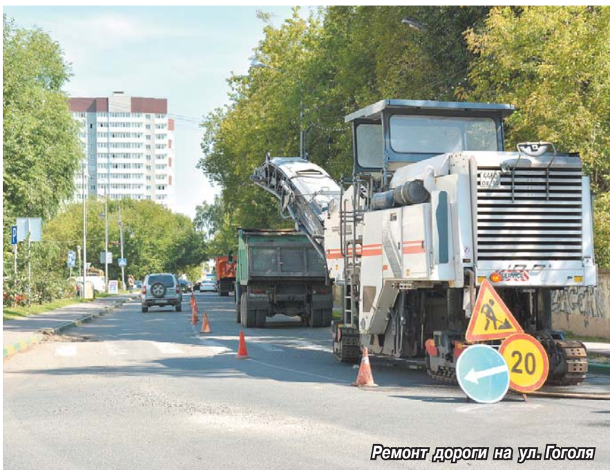
Ремонт дороги на ул. Гоголя

От дома № 11 до дома № 28 расширена проезжая часть и по просьбам жильцов устроена тротуарная дорожка. У стадиона «Урожай» (дом № 15А) пришел в негодность въезд: асфальт местами провалил-