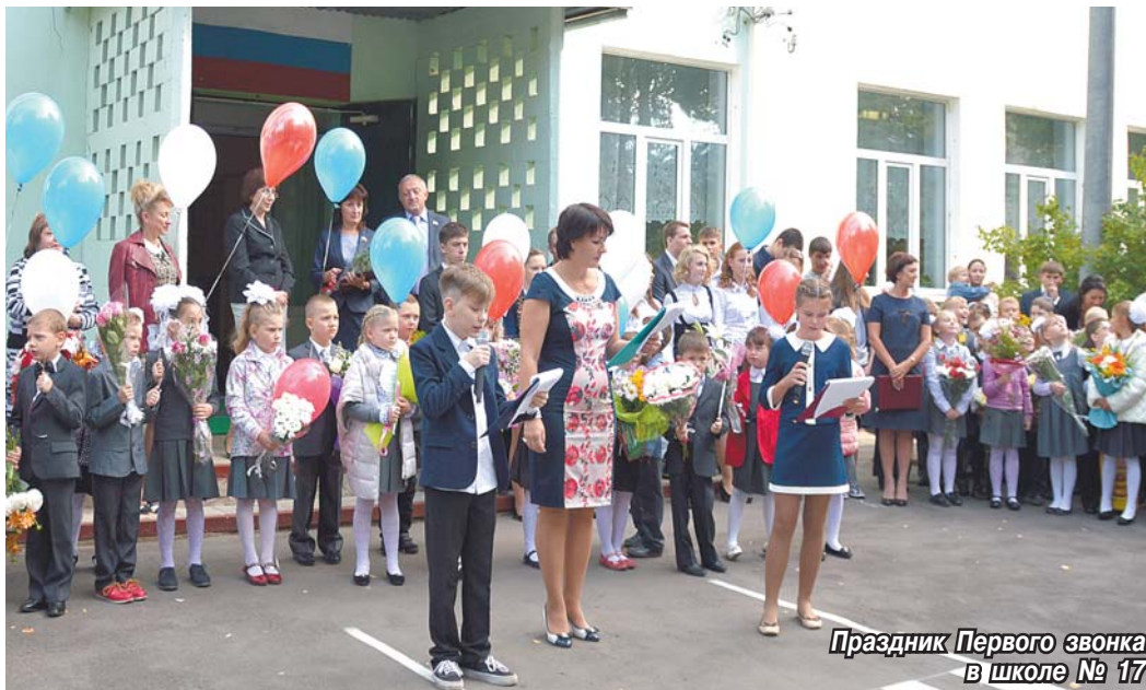
Праздник Первого звонка в школе № 17