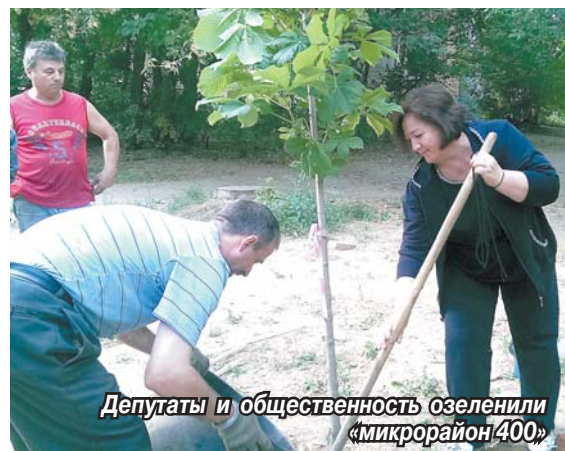
Депутаты и общественность озеленили «микрорайон 400»

Депутаты и инициативные жители, следуя примеру администрации, взялись за озеленение своего «микрорайона 400».