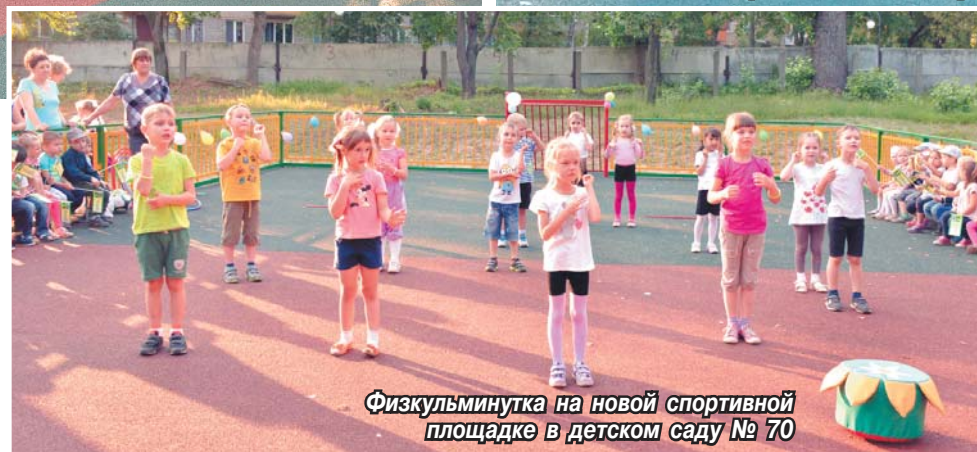
Физкультминутка на новой спортивной площадке в детском саду № 70