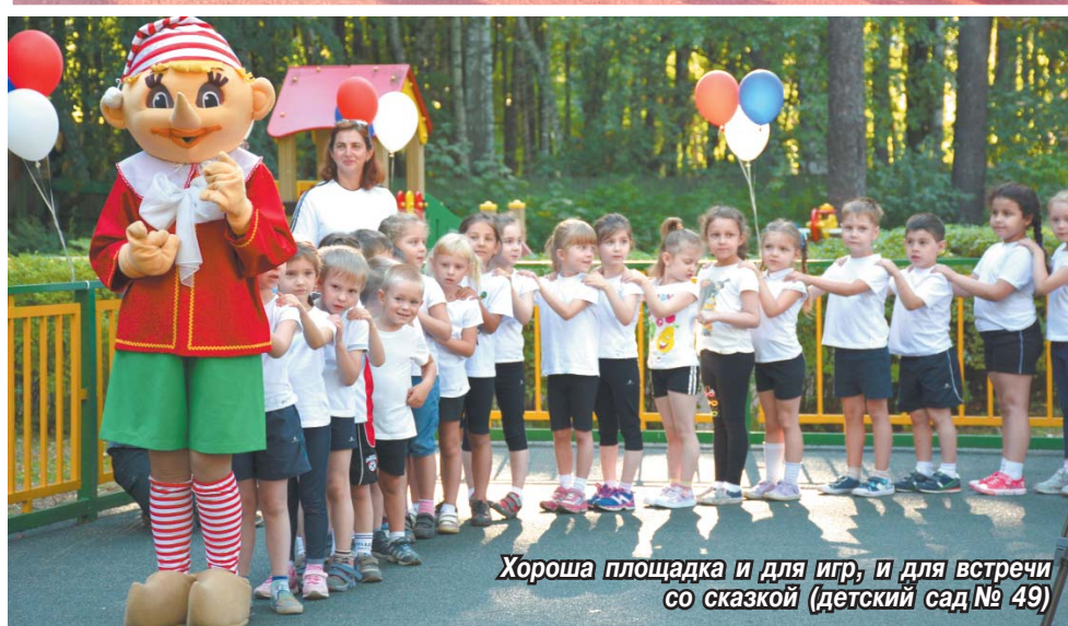
Хороша площадка и для игр, и для встречи со сказкой (детский сад № 49)