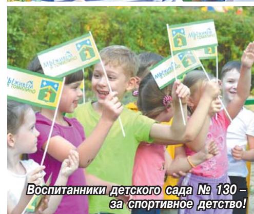
Воспитанники детского сада № 130 – за спортивное детство!