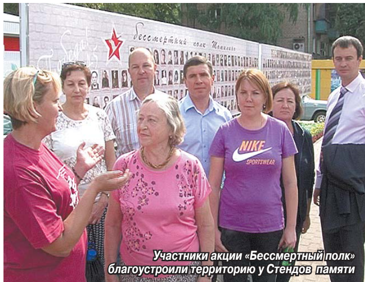
Участники акции «Бессмертный полк» благоустроили территорию у Стендов памяти

1 сентября исполнился год, как томилинцы присоединились к Всероссийской патриотической акции «Бессмертный полк». За это время журналисты газеты «Томилинская Новь» объединили в ряды сторонников движения более 500 семей, благодаря которым около 800 имен солдат и офицеров Красной армии уже увековечено на поселковых Стендах памяти. По сей день в редакцию газеты продолжают поступать воспоминания о героях былых времен, а в работе по увековечиванию памяти погибших и уже ушедших из жизни фронтовиков появляются новые направления.