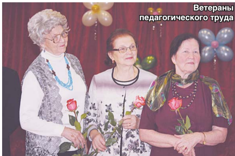
Ветераны педагогического труда

Люберецкой средней общеобразовательной школе № 8 исполнилось 65 лет