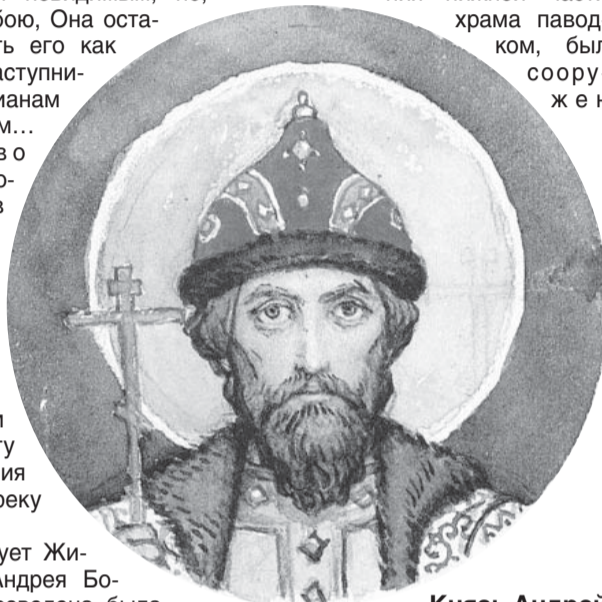
Князь Андрей Боголюбский (картина В.М. Васнецова)

Согласно Лаврентьевской летописи, строили Покровскую церковь по наказу князя Андрея «из всех земель мастера», так что возведена она была «за одно лето». Чтобы избежать затопления нижней части храма паводком, был сооружен