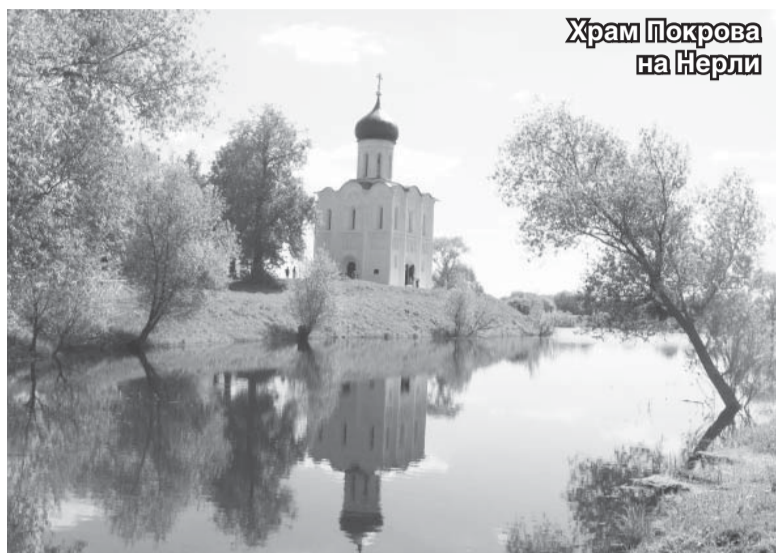
Храм Покрова на Нерли

14 октября православный мир отметит великий праздник – Покров Пресвятой Владычицы нашей Богородицы и Приснодевы Марии.