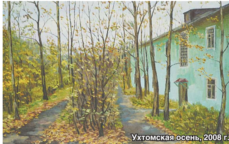
Ухтомская осень, 2008 г.

Адрес библиотеки №101, где проходит выставка: Москва, Кожухово, ул. Лухмановская, д. 17, корп. 1. График работы выставки: вторник – пятница с 13.00 до 20.00; суббота с 11.00 до 18.00; воскресенье и понедельник – выходные дни; последняя пятница месяца – санитарный день. Проезд: авт. 726, 773 до остановки «Река Рудневка».