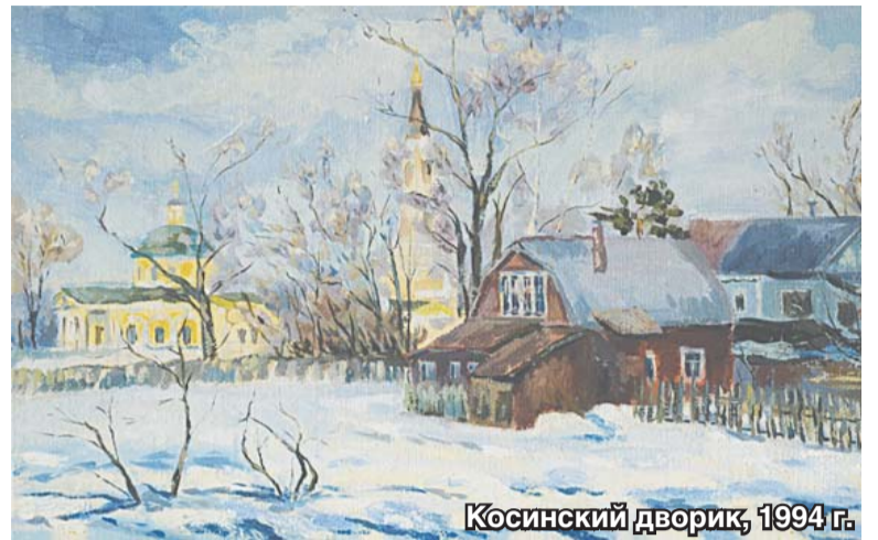
Косинский дворик, 1994 г.

Ученики Сергея Александровича участвовали в более чем 200 выставках: в Москве, Санкт-Петербурге, Екатеринбурге, Магадане, Алма-Ате, Париже, Антибе, Дижоне, Гренобле, Йоханнесбурге, Нью-Йорке, Пекине, Гаване, Риге и других городах. Более 40 выпускников окончили художественные, архитектурные, дизайнерские, педагогические учебные заведения.