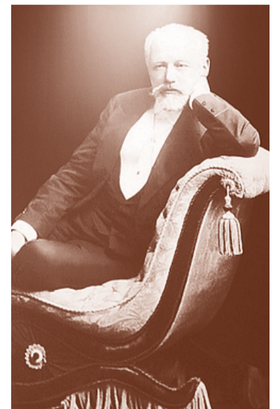
Полосу подготовила Татьяна САВИНА

На оба указанных мероприятия вход свободный. Адрес Центра культуры и семейного досуга: Томилино, ул. Пушкина, 34; от ж/д станции «Томилино» по указанной улице – около 10 минут ходьбы.