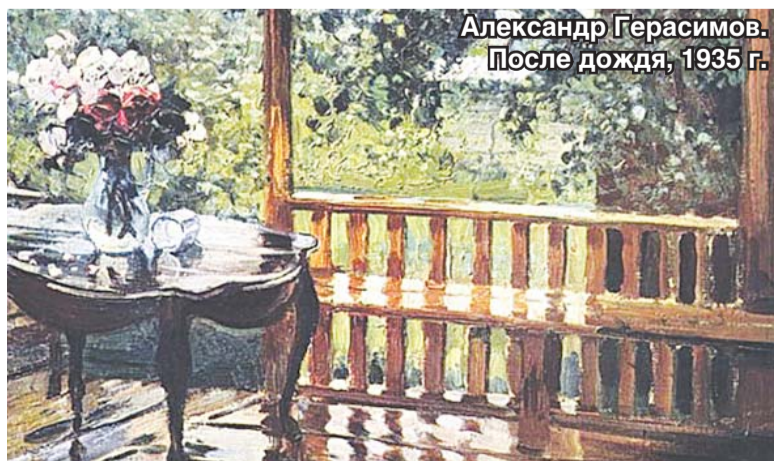
Александр Герасимов. После дождя, 1935 г.