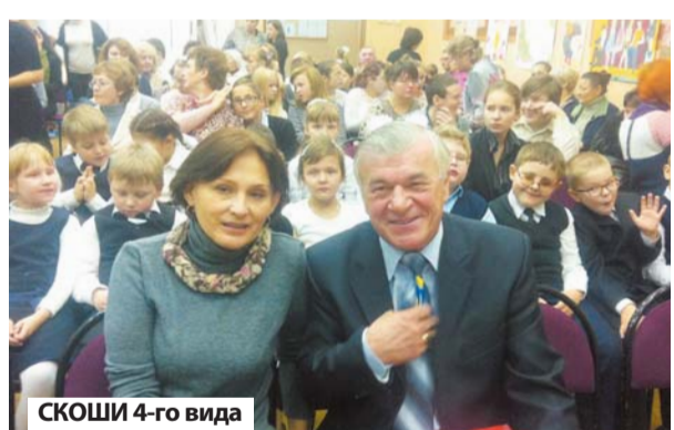
СКОШИ 4-го вида