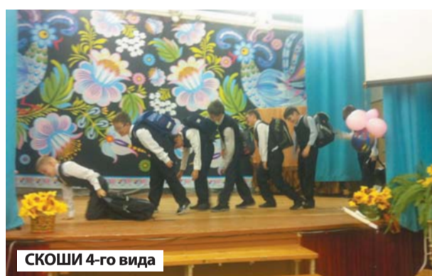
СКОШИ 4-го вида