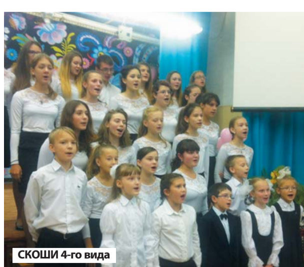
СКОШИ 4-го вида