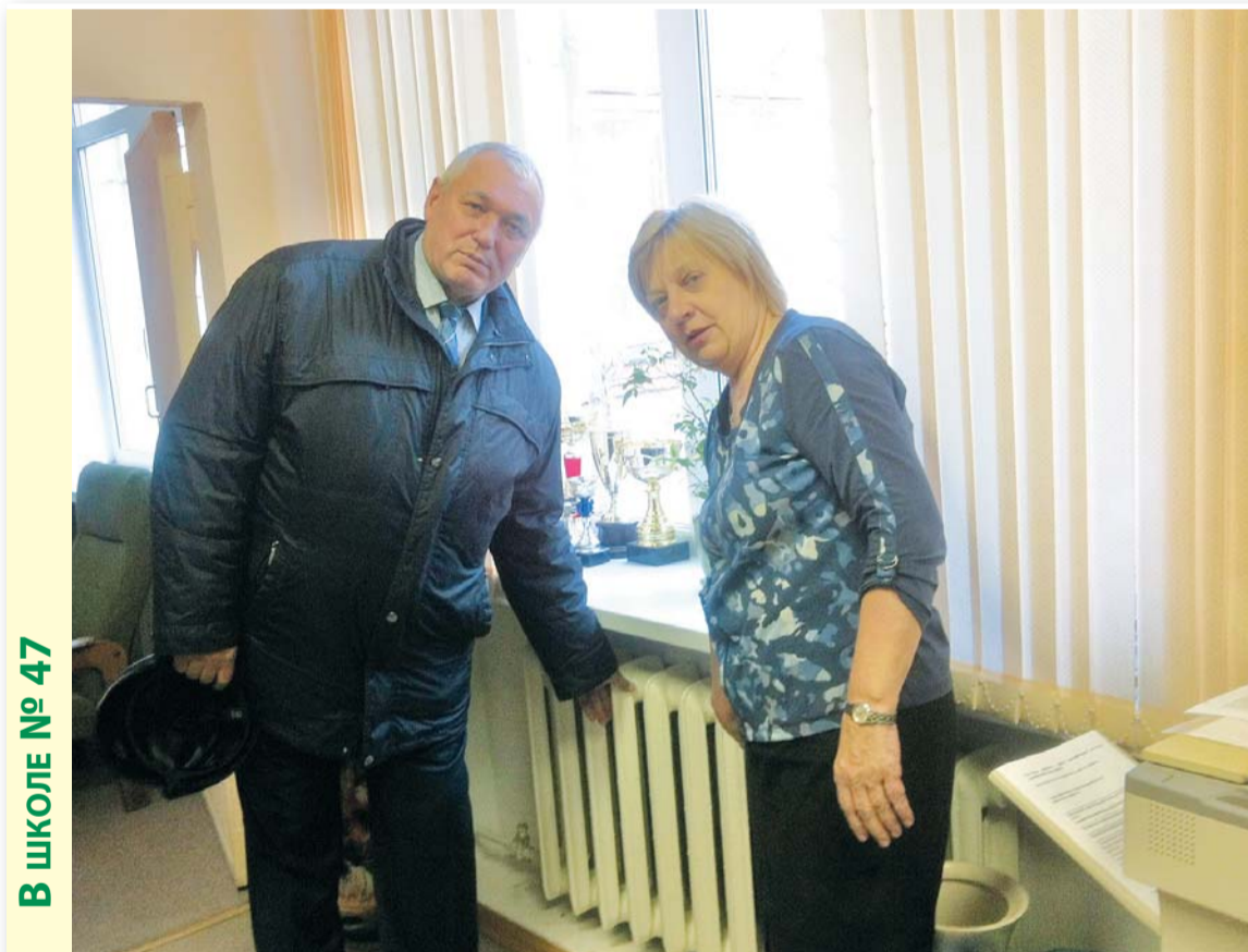
В ШКОЛЕ № 47