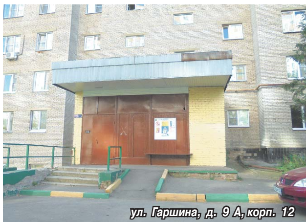
ул. Гаршина, д. 9 А, корп. 12

– Цоколь – тот элемент конструкции дома, который защищает фундамент здания от влаги и разрушения. Поэтому в преддверии зимне-весеннего сезона, известного обильными осадками и перепадами температур, мы стараемся привести в