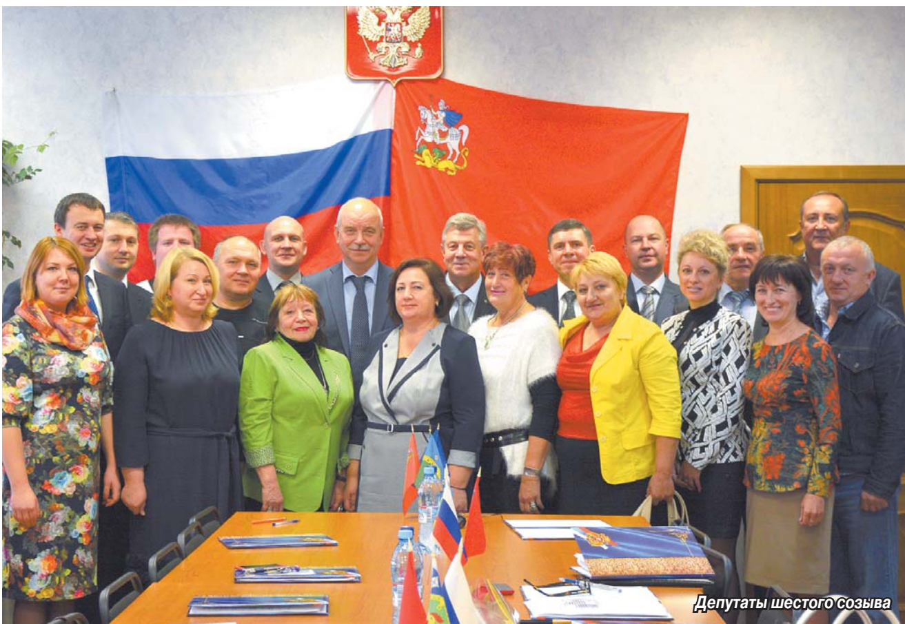
Депутаты шестого созыва

29 сентября состоялось первое рабочее заседание Совета депутатов шестого созыва. Новый законодательный орган Томилино избрал главу городского поселения, выдвинул из своего состава представителей в районный Совет депутатов, утвердил обновленную структуру администрации и назвал дату назначения ее руководителя.