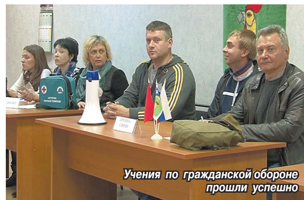
Учения по гражданской обороне прошли успешно

В Томилино прошли широкомасштабные учения по ГОиЧС, приуроченные ко дню образования в нашей стране системы гражданской обороны.