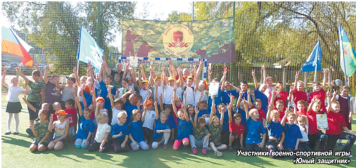
Участники военно-спортивной игры «Юный защитник»

В конце сентября на территории школы № 14 состоялась премьера спортивно-патриотического мероприятия Томилинского молодежного клуба – «Юный защитник». Таким образом, окончательно выстроилась стройная система патриотического воспитания молодого поколения томилинцев через военизированные игры.