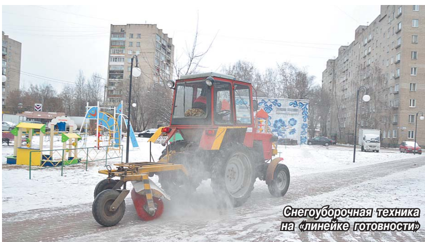
Снегоуборочная техника на «линейке готовности»