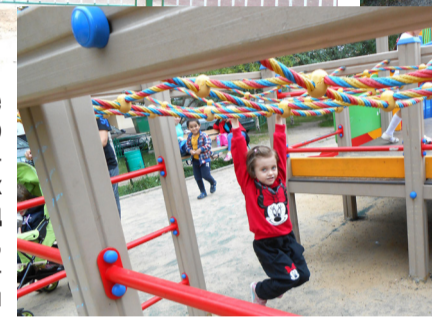
Люберецкий район вошел в пятерку лидеров Московской области по количеству детских площадок и их оснащённости.