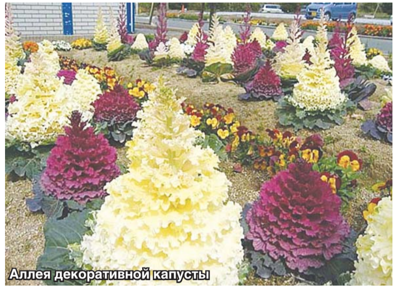
Аллея декоративной капусты

Сорта декоративной капусты отличаются не только разнообразием форм и окрасок листьев, но и по размерам растений. Существуют низкорослые, среднерослые и высокорослые сорта, где высота растений колеблется от 20 до 130 см, диаметр некоторых из них может достигать 1 метра. Природа была явно щедра на выдумку, когда создавала декоративную капусту: листья ее могут быть длиной от 20 до 60 см, шириной – от 10 до 30 см; причудливая форма этих листьев и зубчатые края часто делают их курчавыми, а всё растение великолепным, пышным и ажурным!