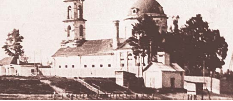
Преображенский храм, Люберцы, 1920 г.