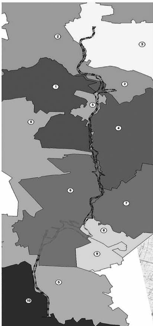
Схема размещения линейного объекта в структуре административно-территориальных единиц М 1:100000