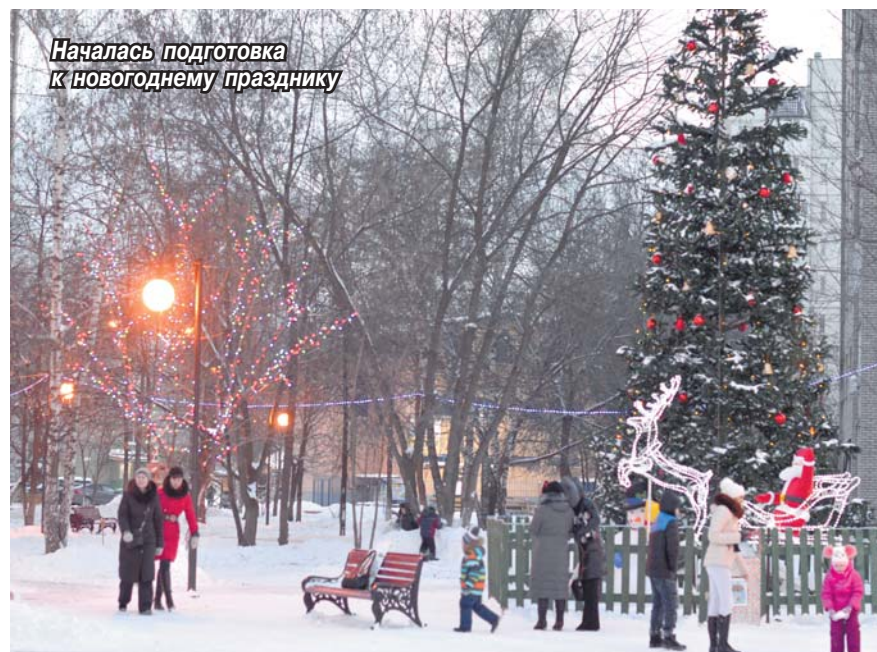
Началась подготовка к новогоднему празднику

Порадуют томилинцев световые растяжки на ул. Гоголя и Пушкина. Праздничное настроение создаст иллюминация на главной улице поселка – ул. Гоголя. Особое внимание будет уделено месту традиционных ледовых забав и спортивных турниров – стадиону «Урожай». Здесь украсят великолепную ель, обеспечат хорошее освещение и отличный лед. Уже подготовлена площадка для обустройства катка на ул. Пионерская, 24. Если погода будет благо-