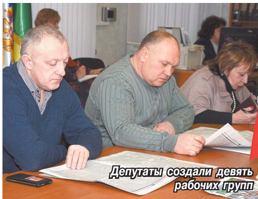
Депутаты создали девять рабочих групп