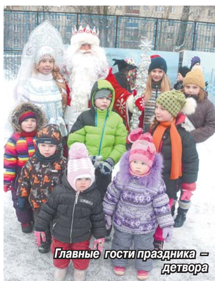
Главные гости праздника – детвора

Стартует череда народных гуляний 26 декабря. По традиции праздничные торжества откроет коллектив Центра культуры и семейного досуга. За два выходных дня театрализованную новогоднюю постановку «Волшебное окно» он представит на трех площадках: в мкр. Птицефабрика, на улицах Гоголя и Пушкина.