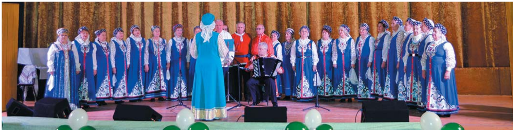
В субботу состоялся отчётный концерт Малаховского хора ветеранов «Поющие сердца».