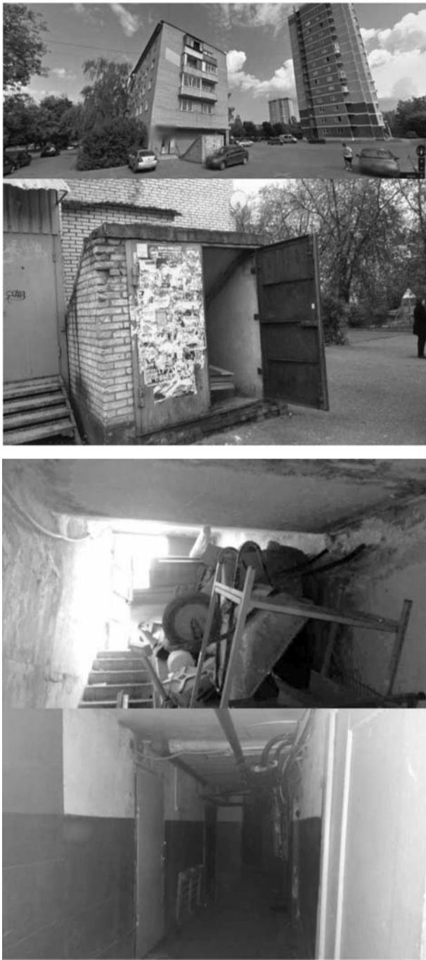
Приложение 3 Форма