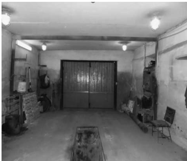
Приложение 3 Форма