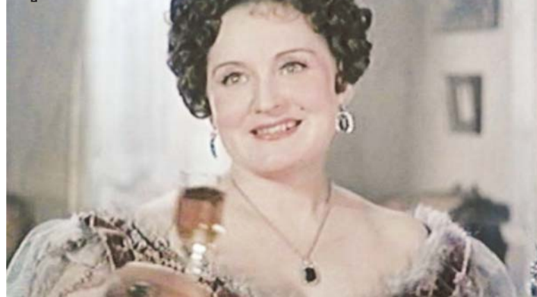
Кадр из фильма «На подмостках сцены»

индивидуальный стиль актрисы Марии Бабановой сложился под влиянием В.Э. Мейерхольда. Роли, сделанные под его руководством, пользовались безоговорочным признанием зрителей и театральных критиков. А какой режиссёр сыграл ключевую роль в Вашей жизни? Полагаю, это Николай Павлович Охлопков?