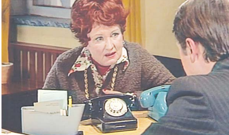
Кадр из телесериала «Следствие ведут знатоки»

стране поменялось. Так моё 4-е января стало 17-м. Но мне это даже на руку. Ведь с 1 по 10 число вся страна отмечает новогодние праздники. Ну и зачем мне туда влезать? Пусть поспразднуют, а потом уже и мой день рождения настанет. (Смеётся).