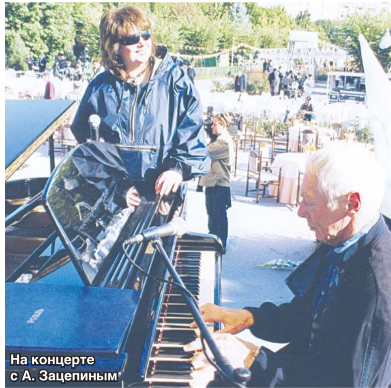
На концерте с А. Зацепиным

Надоели песни об аморфной любви. Хочется чего-нибудь новенького. Но, главное, чтобы в песне была душа.