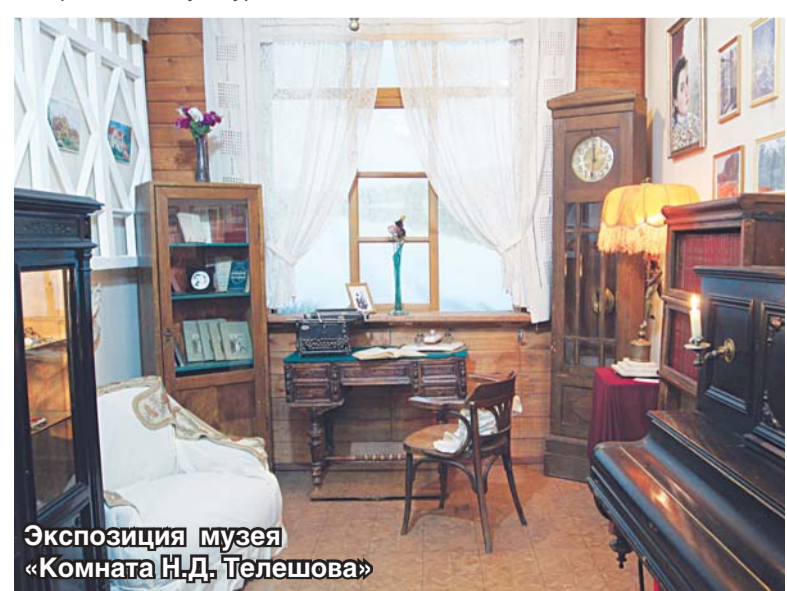
Экспозиция музея «Комната Н.Д. Телешова»

Беседовала Татьяна САВИНА