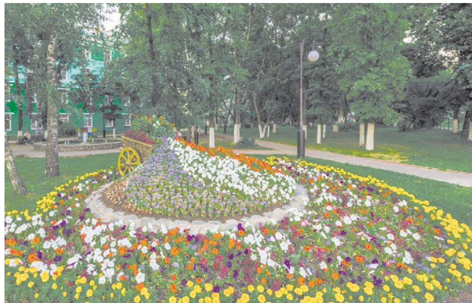
Цветы с весны до осени

С весны до осени мы озеленяем и украшаем поселок. Ранней весной на томилинских улицах расцветают тысячи тюльпанов, им на смену приходят подвесные кашпо, топиарные фигуры, цветущие клумбы.