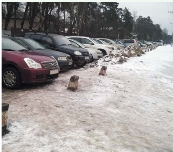
Ул.Южная очищена от мусора

Запущенный в прошлом году интернет-портал «Добродел» набирает обороты. Всё больше людей отмечают удобство данной системы. По словам губернатора Московской области Андрея Воробьёва, система «Добродел» работает, прежде всего, на эффективность и открытость власти.