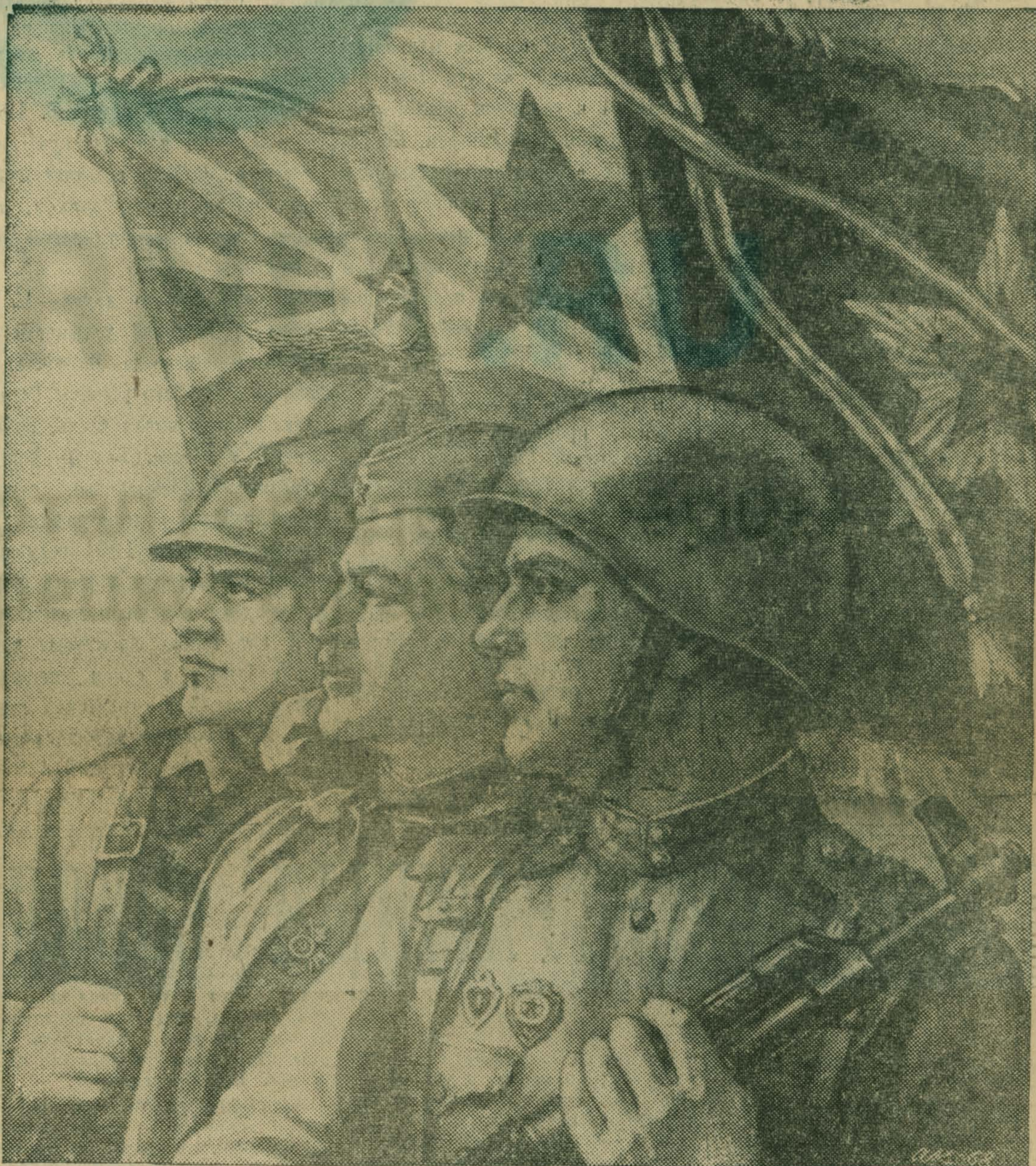
Фотодокументы из истории

Советские люди могут спокойно трудиться на благо любимой Отчизны, строить коммунизм. На страже нашего труда стоят самые мощные, самые боеспособные в мире Вооруженные Силы СССР.