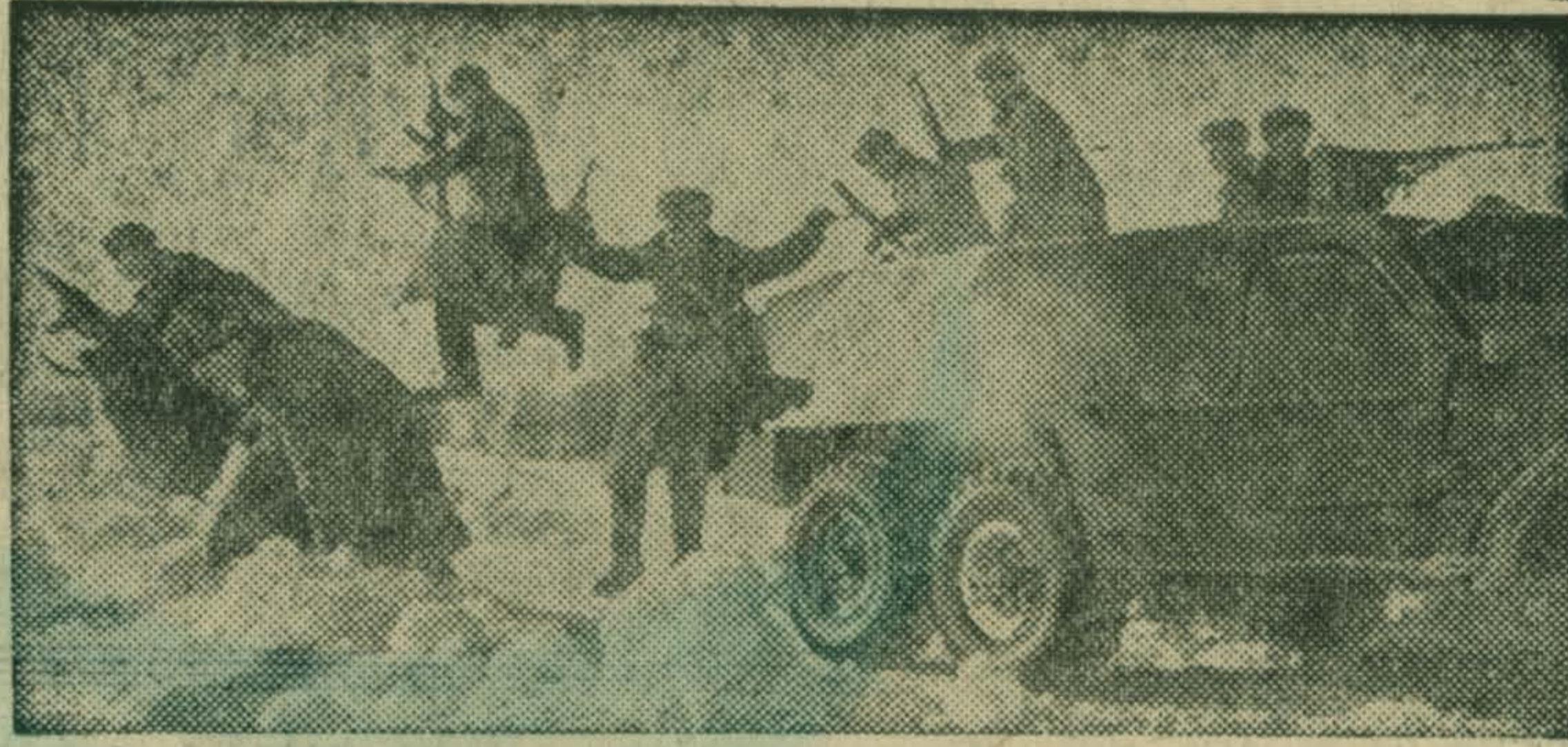
Во время учений. Воины овладевают боевым мастерством.