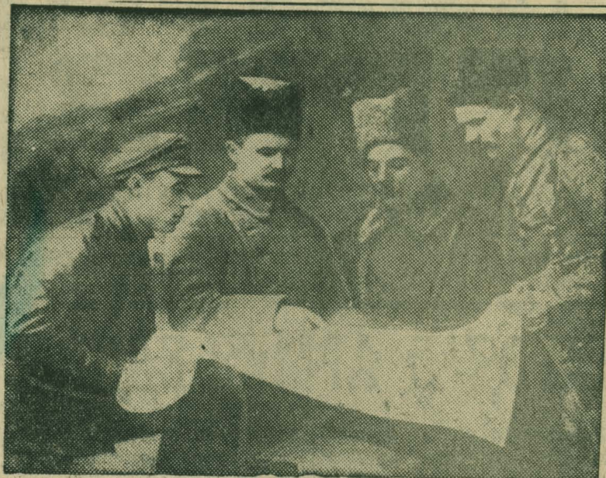
А. Я. Пархоменко, К. Е. Ворошилов, Е. А. Шаденко и Ф. Н. Алябьев (на снимке справа налево). Царицынский фронт, 1918 год.